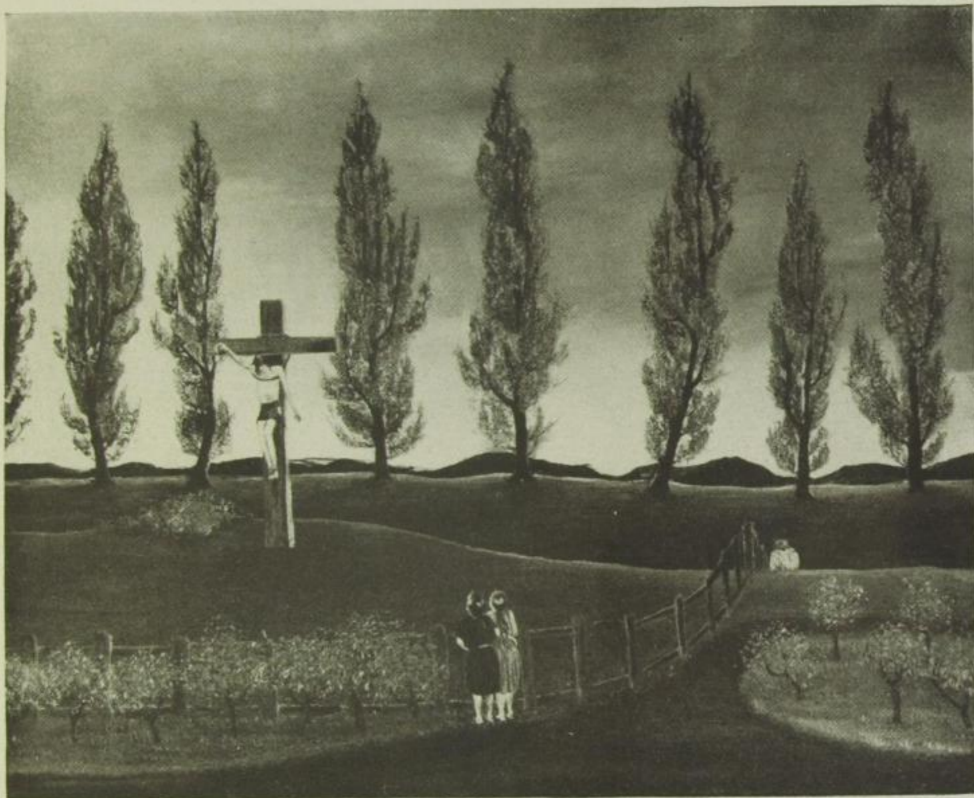
Frühjahrsausstellung der Preußischen Akademie Joachim Ringelnatz, Der Mann am Kreuz