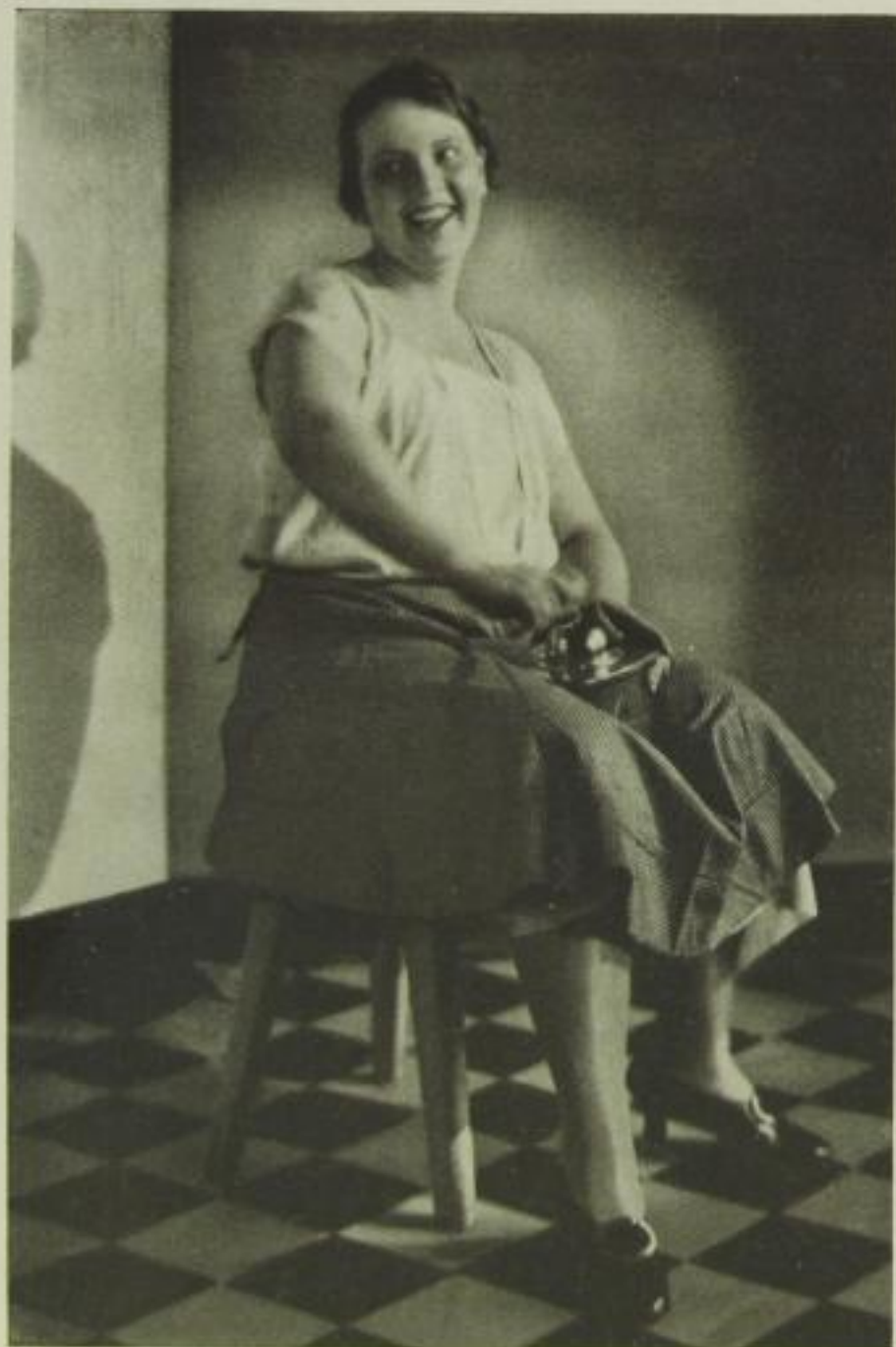
Hausfrau in Sachsen, der Heimat des Bliemchenkaffees