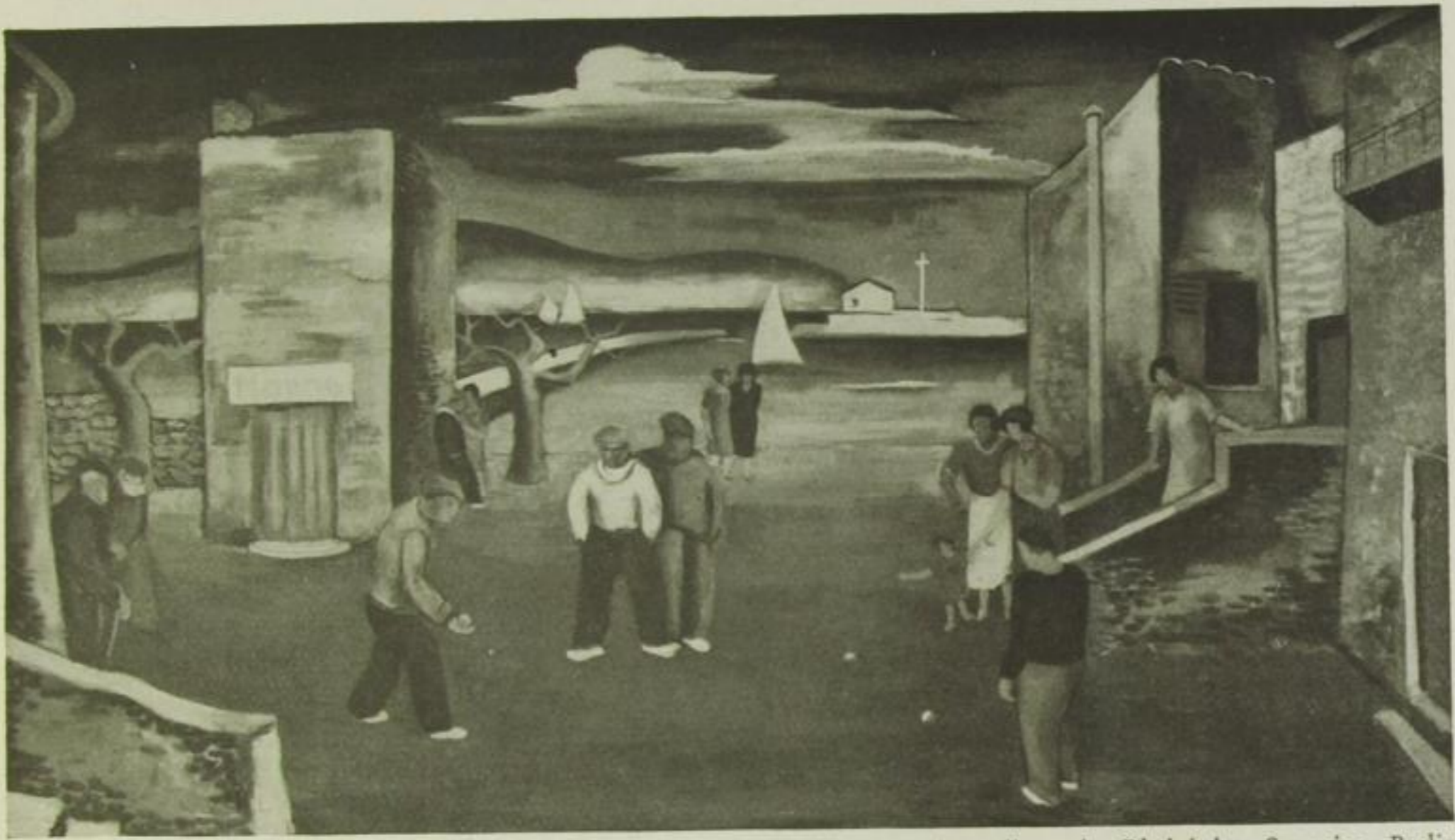
Ausstellung der Rheinischen Sezession, Berlin Ari Walter Kampf, Die Kugelspieler (Oel)