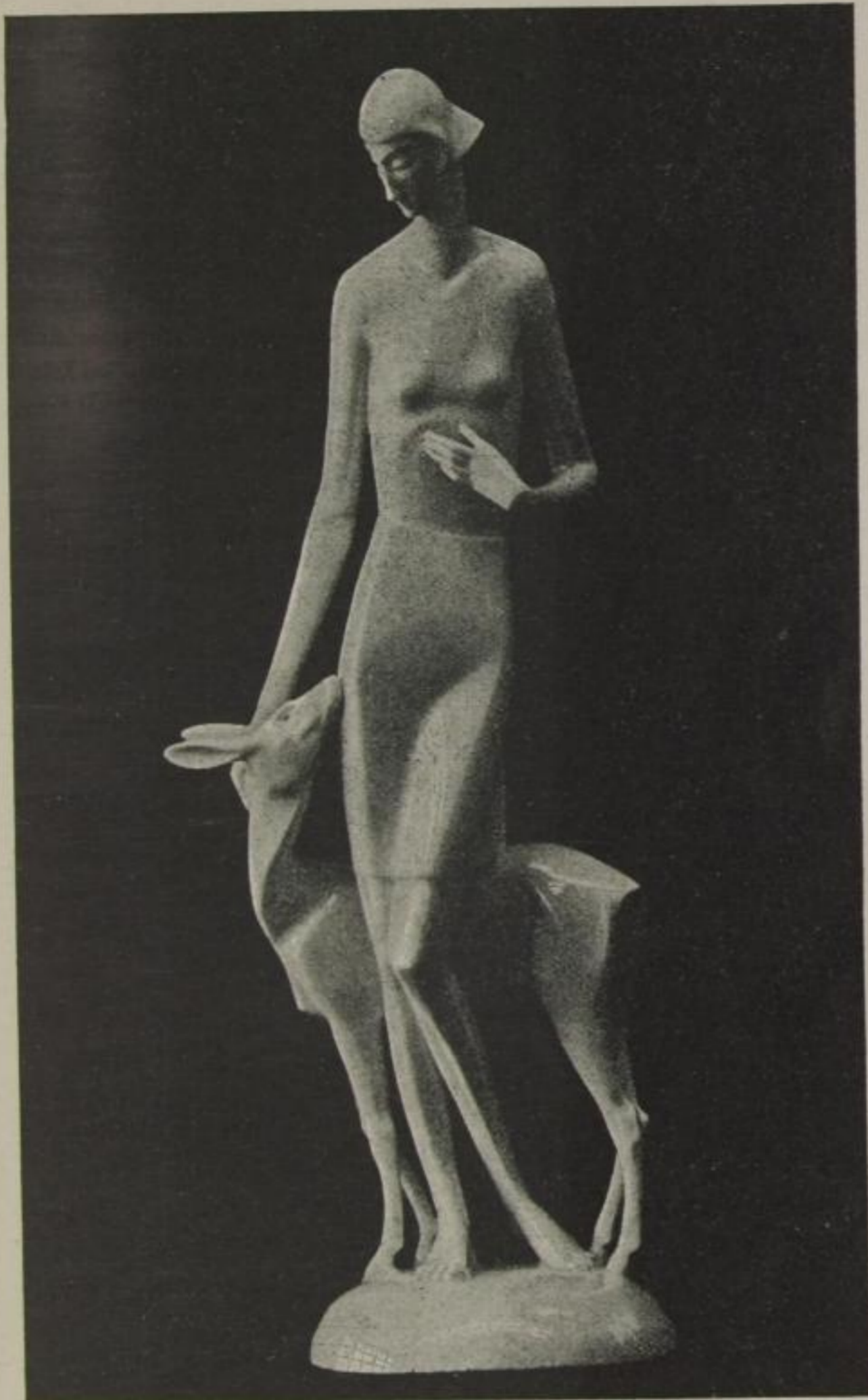
„Märchen“ von Schliepstein