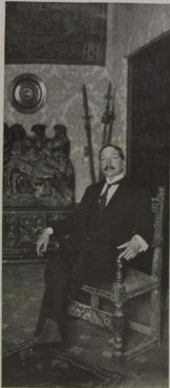
Dr. Enrique Larreta, Schriftsteller