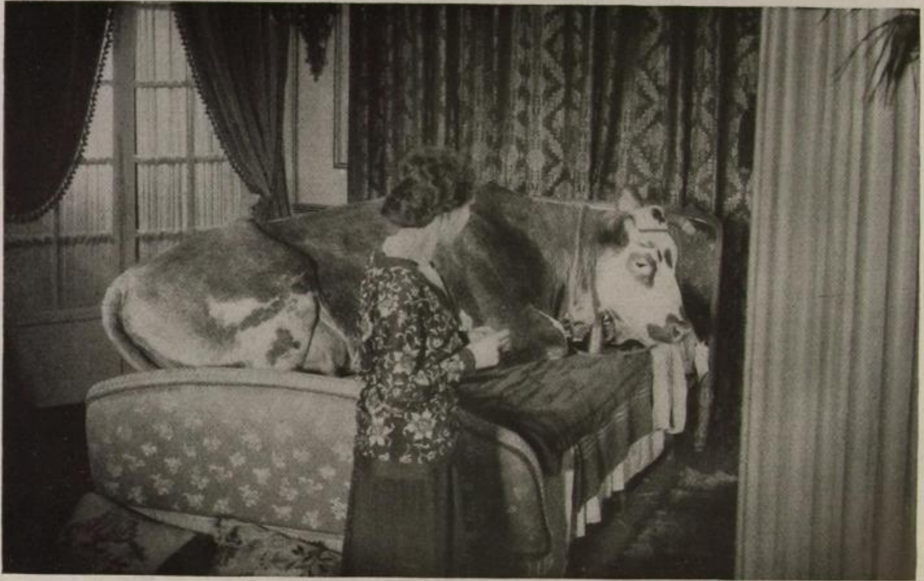
„Das goldene Zeitalter“, Bunuels neuester surrealistischer Film,