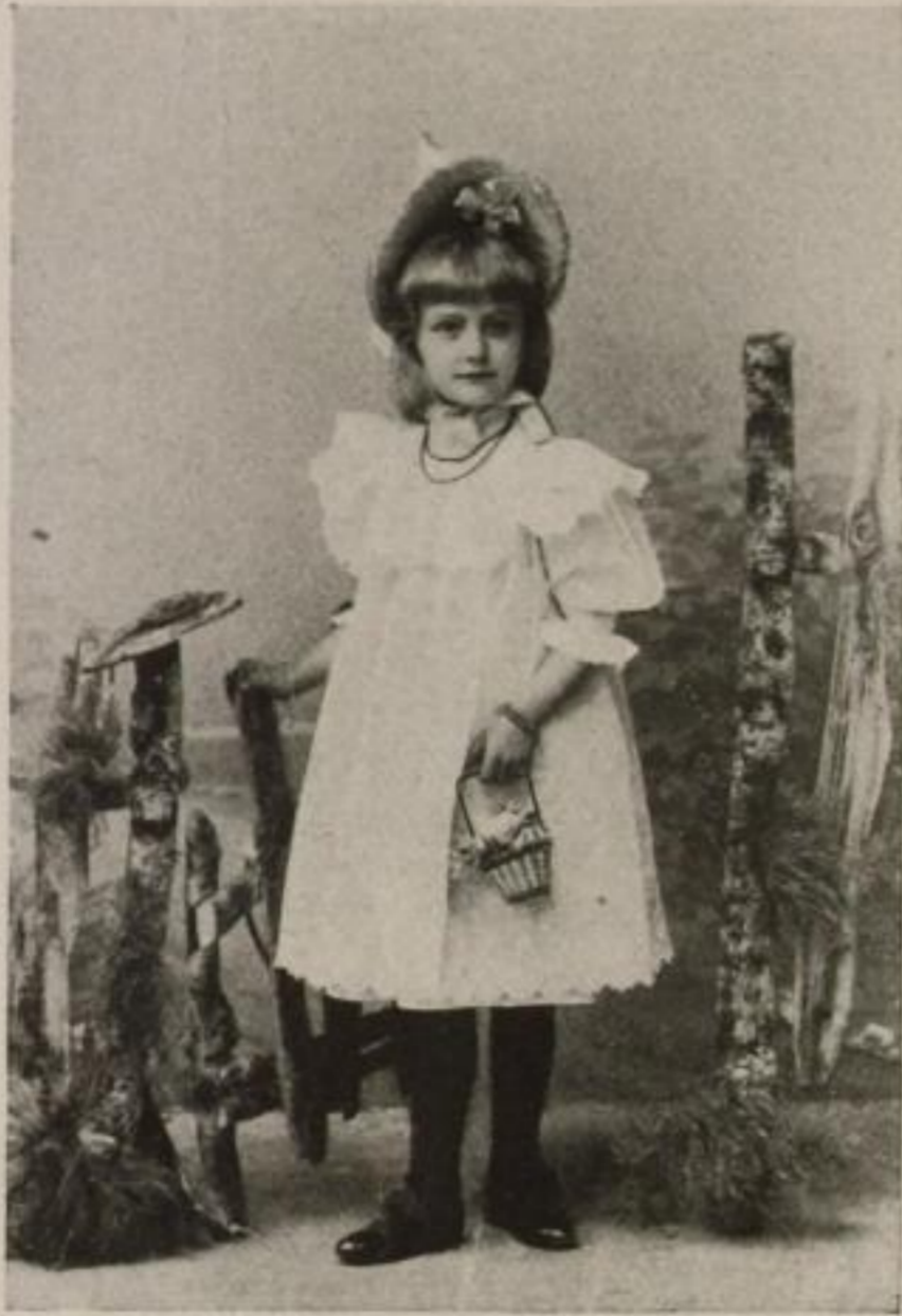
Henny Porten, die Mutter des deutschen Films sechsjährig