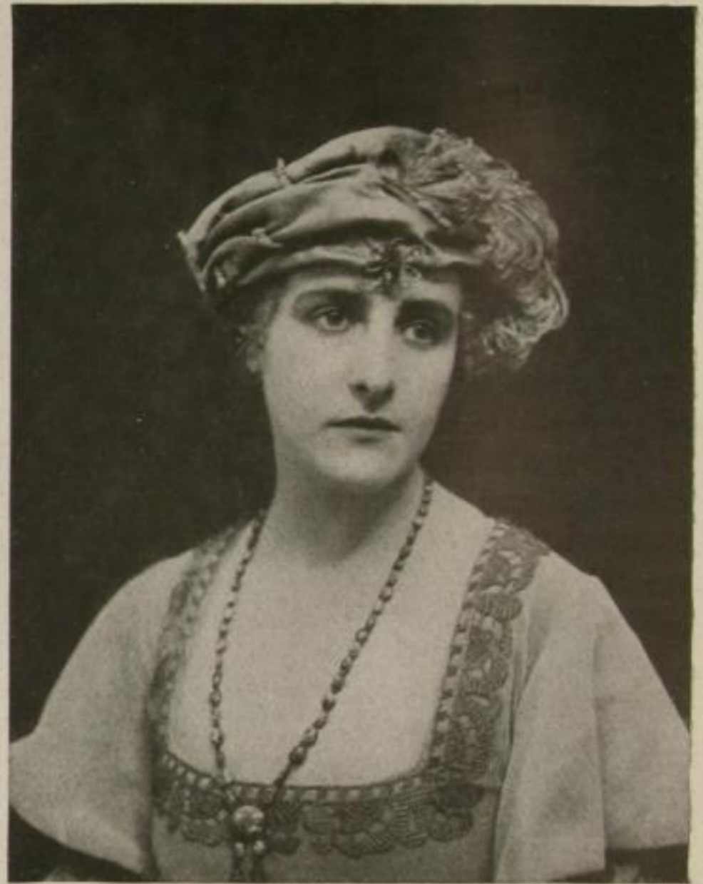
als „Anna Boleyn“