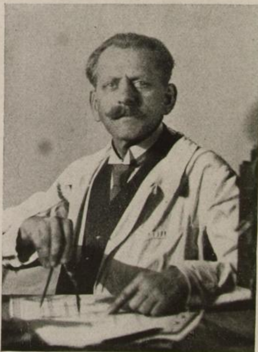
Max Skladanowsky (Berlin) die Väter des Kinematographen