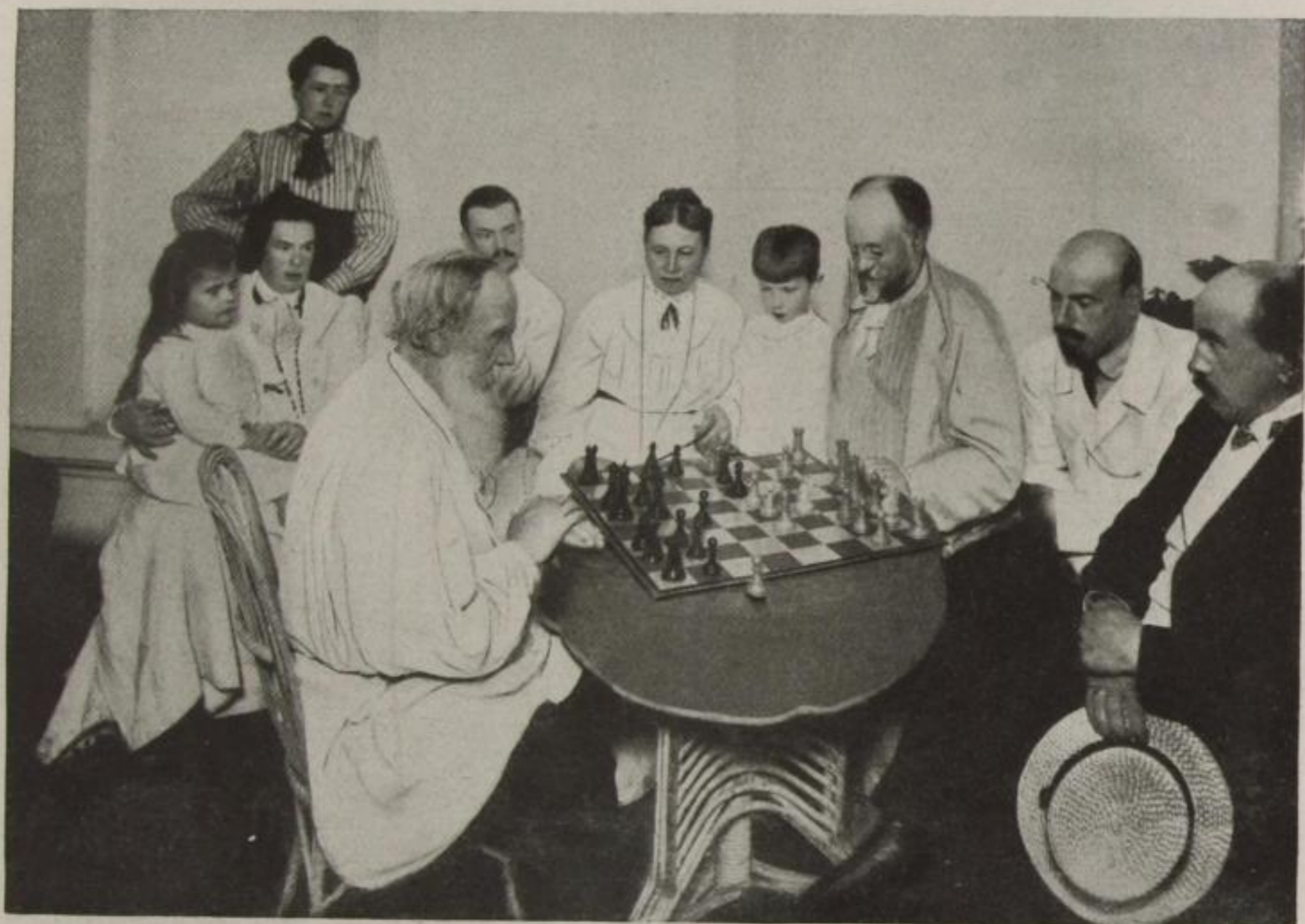
Leo Tolstoi spielt Schach (links: Enkelin, Frau, Tochter)