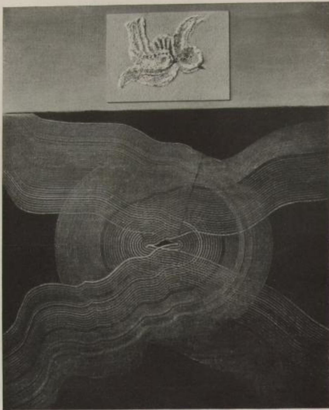
Aus der „Kunst des 20. Jahrhunderts“ (Propyläen-Kunstgeschichte) Max Ernst, Meer und Schwalben (Öl)