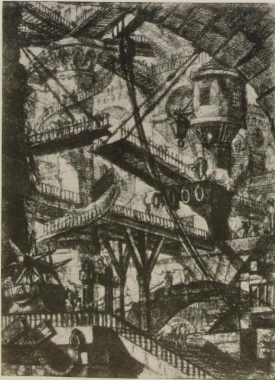
Ein Blatt aus Piranesis „Prigioni e carceri“ (18. Jahrhundert)