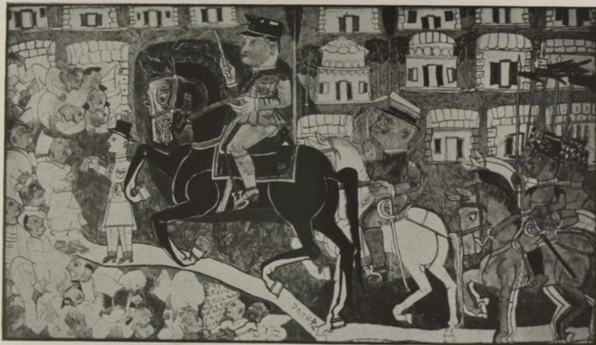
Erythräische Kunst von heute