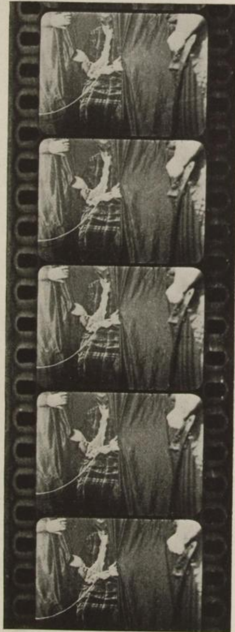
Film-Aufnahme der Teleplasma-Produktion