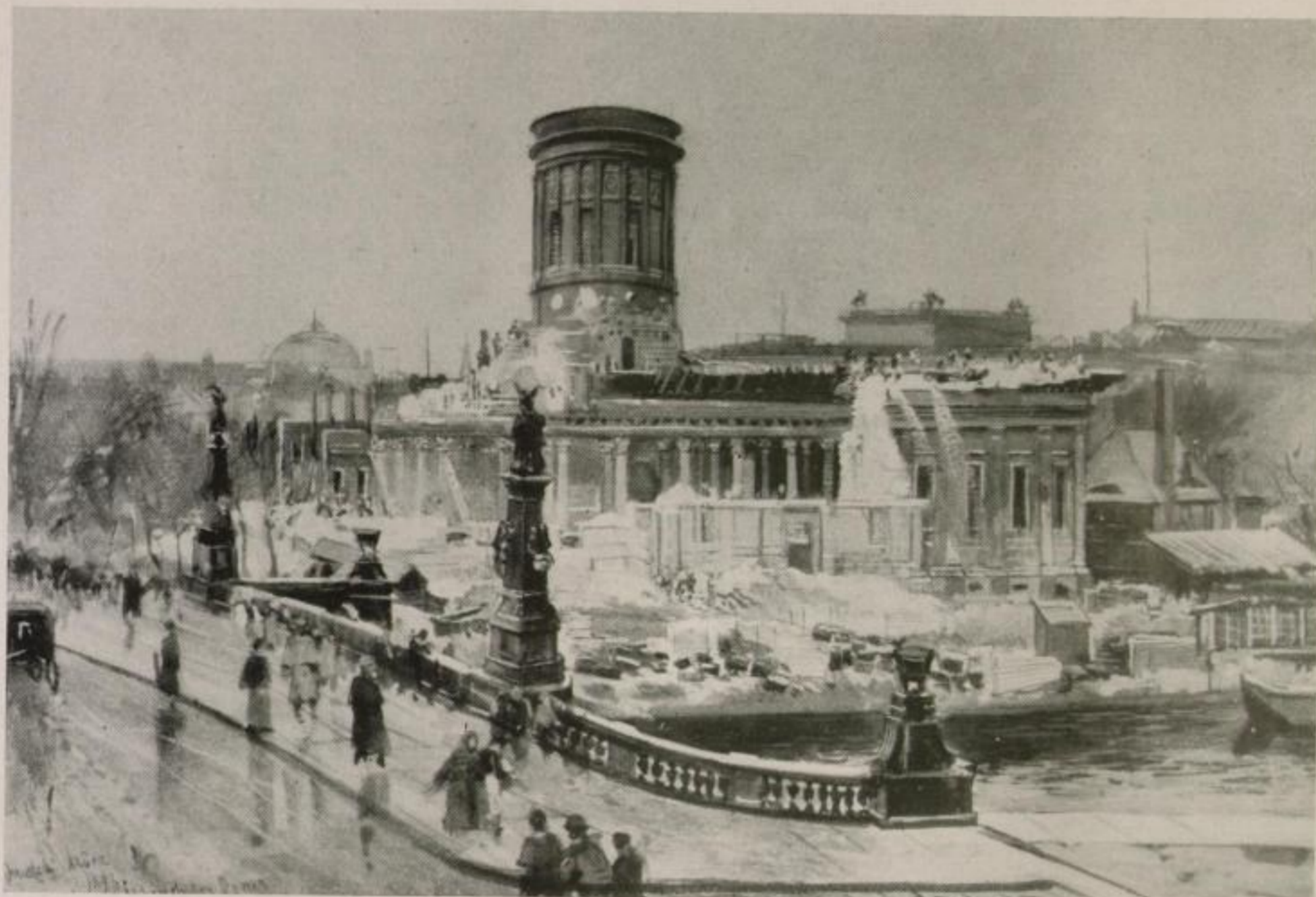
Abriß des alten Domes 1893