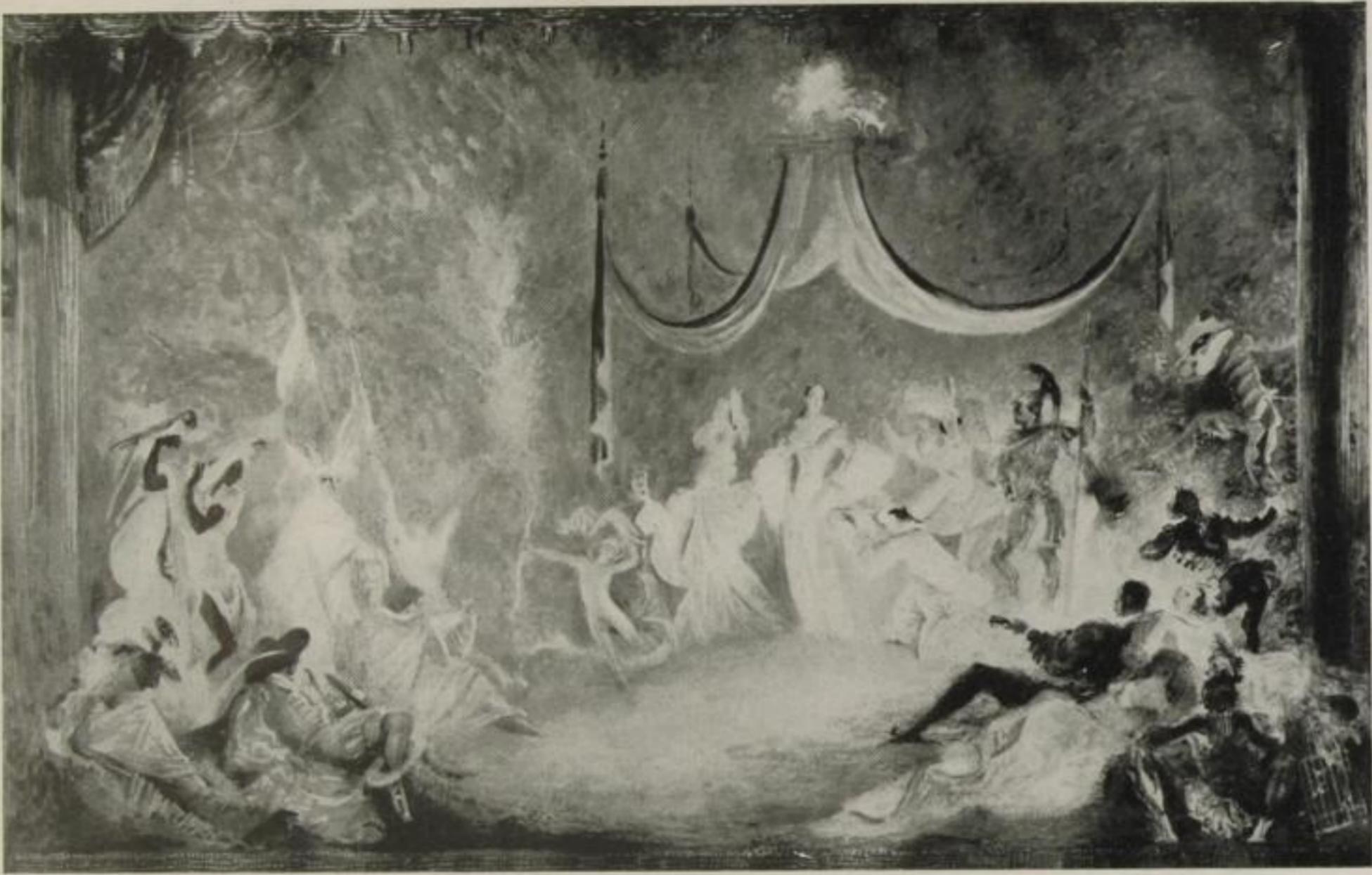
Paul Scheurich, Vorhang im Deutschen Opernhaus, Berlin