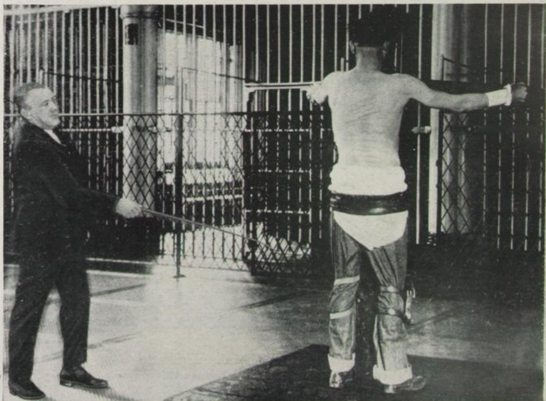
Oeffentliche Auspeitschung eines Ehebrechers in den Vereinigten Staaten

Die sausende Zeit schleppt rudimentäre Begriffe und Einrichtungen mit sich durch die Jahrhunderte. Das finstere Mittelalter spukt noch im 20. Jahrhundert. Ueberlieferungen haben sich in Volksgebräuchen und Einrichtungen so festgebissen, daß eine Aenderung nur mit einer Wandlung des Volkscharakters verknüpft sein kann. Der Aberglaube, der sich vielseitig mit modernen