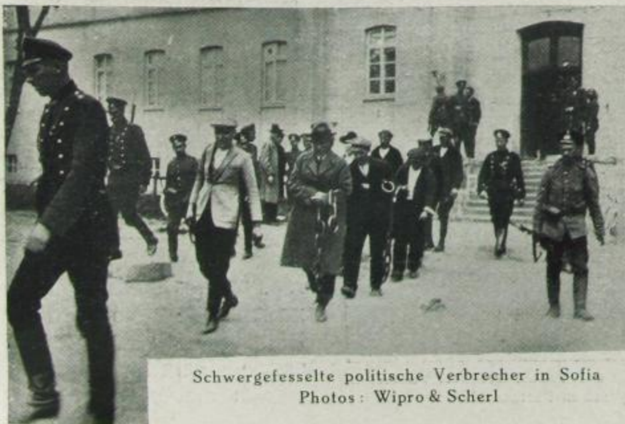
Schwergefesselte politische Verbrecher in Sofia

Häuser und Speicher auf Kähne, wie sie ehemals vor Jahrtausenden als Schutz gegen Tiere und Menschen errichtet wurden.