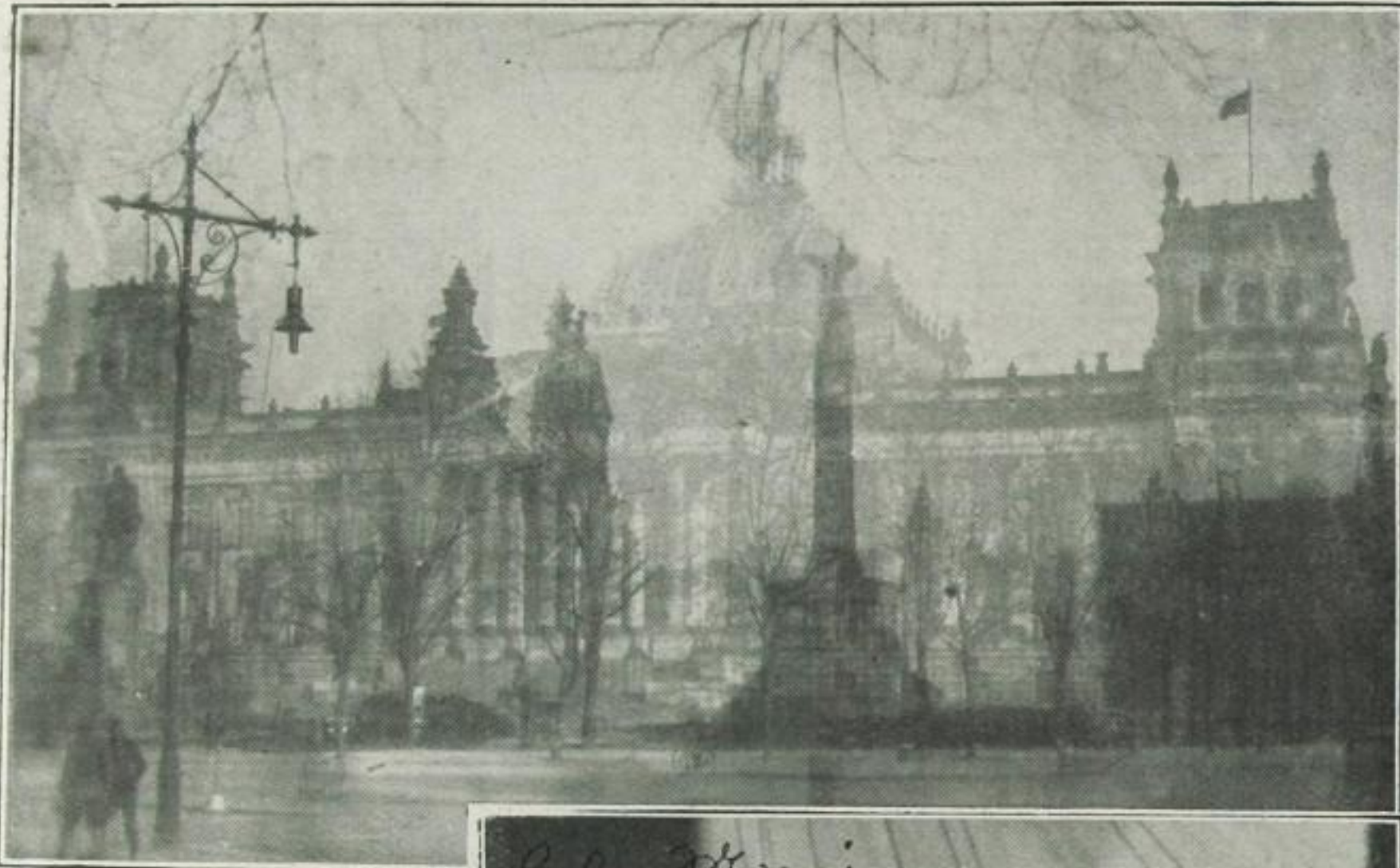
Drei Ansichten von Berlin: der Reichstag — die Siegessäule — ganz zart im Hintergrund der Dom