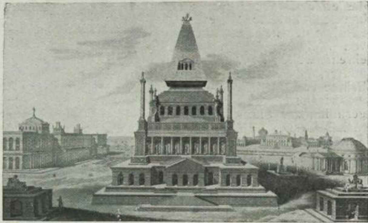
Das Mausoleum der Antike: Artemisia baut ihrem abgeschiedenen Gatten in Halikarnassos das prunkvollste Grabmal, das die Welt jemals kannte

tausend Jahren, ja, die konnten noch die Fassaden ihres Sonnentempels mit Goldplatten tapezieren, und die gotischen Dome des europäischen Mittelalters sind mit den Groschen der Bürger und Bauern gebaut worden. Heute langt es gerade noch für den von den Idealisten der Welt zusammenge