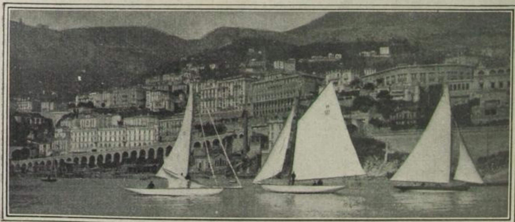
Start zur Segelregatta in Cannes

Der Gute hatte seit seiner Ankunft im Dorado der Göttin Fortuna keine Gelegenheit gehabt, von der Umgebung des alleinselig-