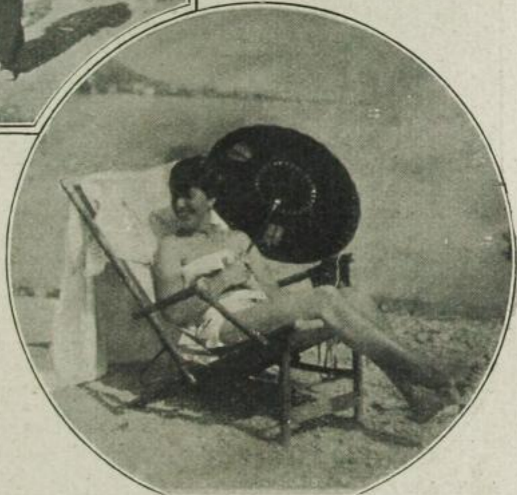
— — und Lebensfreude dicht beieinander

Man promeniert auf der Esplanade. Man beobachtet, bewegt ob soviel Sonderheit, jene rassige Ueber-schlanke, die einen Maki-affen mit langem, schwarz-weißgestreiften Schwanz wie ein Hündchen an der Leine führt und die diesem Exoten jeden Tag einen Pullover überzieht, der mit