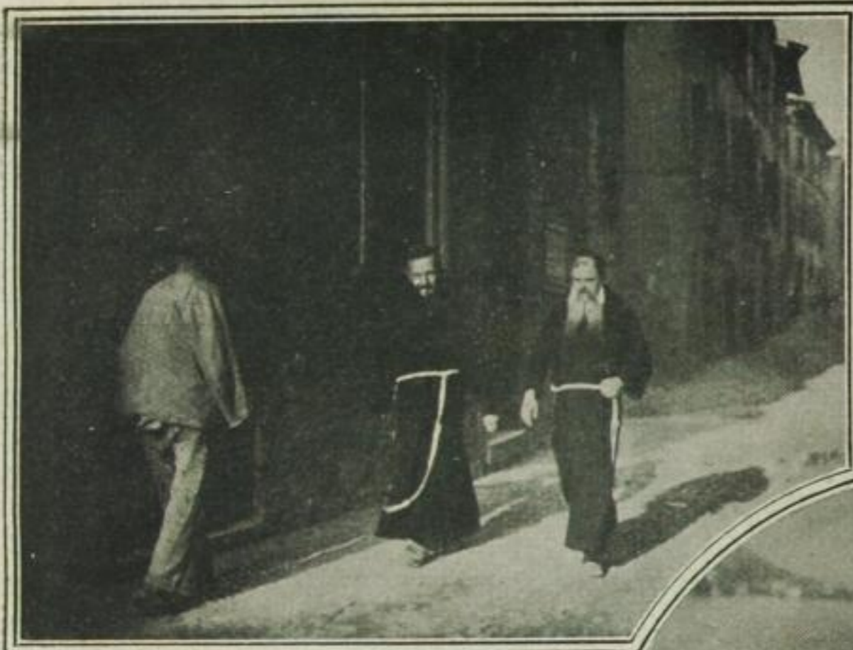
Auch unter dem ewig blauen Himmel des Südens wohnen Entsagung — —

der Farbe ihres eigenen Kostümes harmoniert. Oder man grüßt den berühmten italienischen Meister, der die Welt mit seinen Melodien erfüllt und dessen Wolfshund alle Hunde auf der Esplanade anknurrt. Man bleibt an der Galerie stehen und folgt gespannt dem Taubenschießen. — Der Frühling duftet in Monte Carlo. Die Wundergärten von Cap d'Ail, die Olivenhaine von Cap Martin locken, Galadiners, schöne Frauen, Hochstapler, Jazzband, Juwelen und Perlen. Fortuna auf der gläsernen Kugel. Faites votre jeu! — Le jeu est fait — Rien ne va plus!