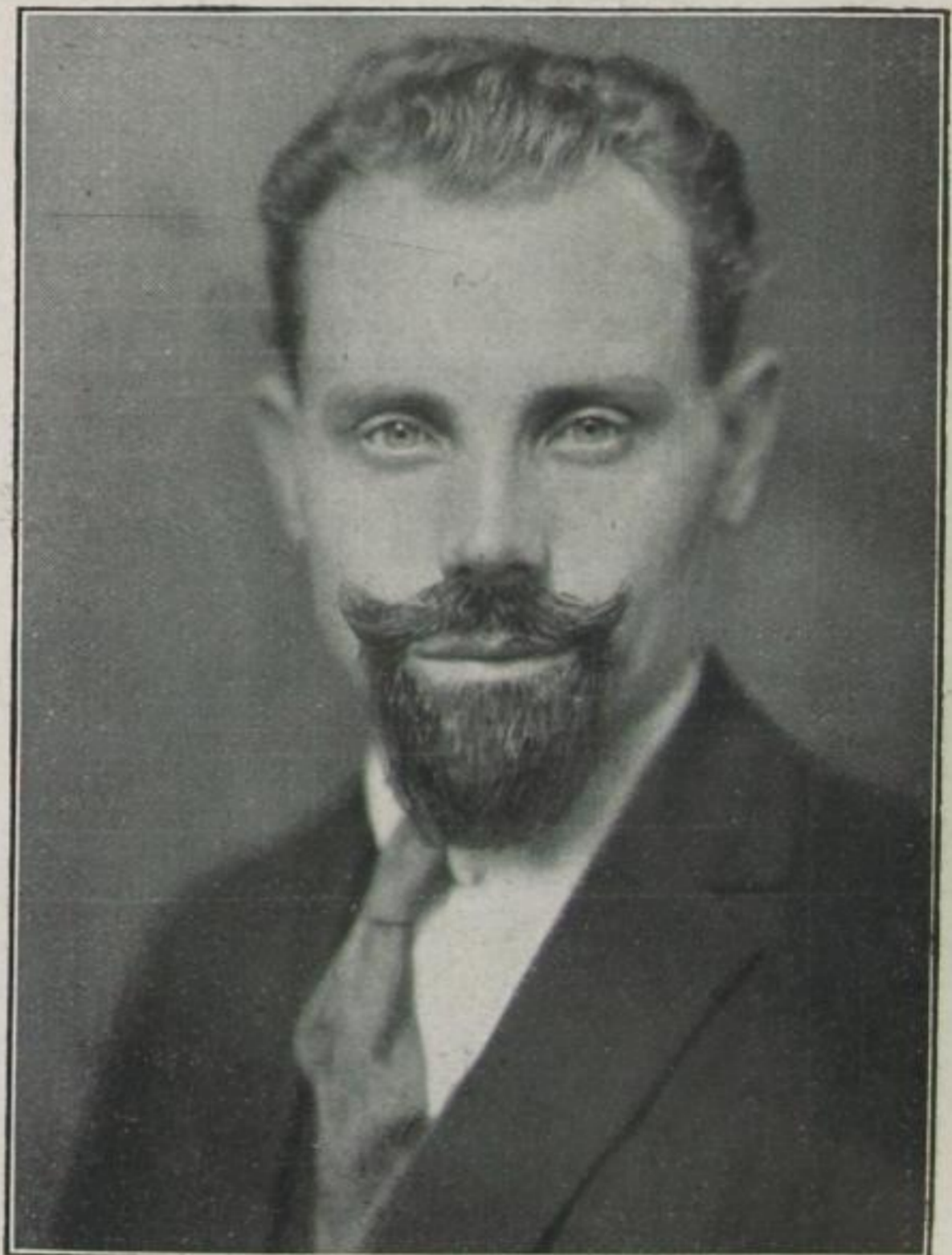
Paova Nurmi, der Vizepräsident

sehen Sie aus? „Herr“-lich! Und männlich! nicht wahr? Diese Männer bilden den Vorstand des Internationalen Bart-Klubs, der erst vor kurzem gegründet wurde und dessen erste Pflicht es ist, die Männerwelt zu der Bartmode unserer Ahnen zu bekehren. Das Präsidium des Klubs, das aus Gustav Stresemann, Charlie Chaplin und Paova Nurmi besteht, arbeitet gegenwärtig — abgeschlossen von dem Trubel der Welt — in einer kleinen Hütte unweit von der Bluffs-Küste an