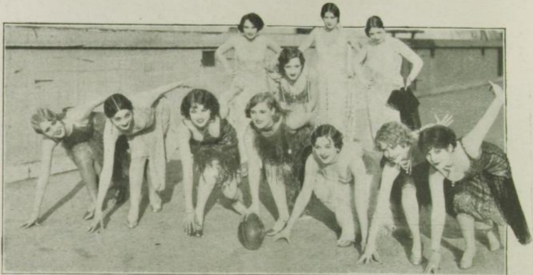
Wettlauf ums Engagement in Hollywood