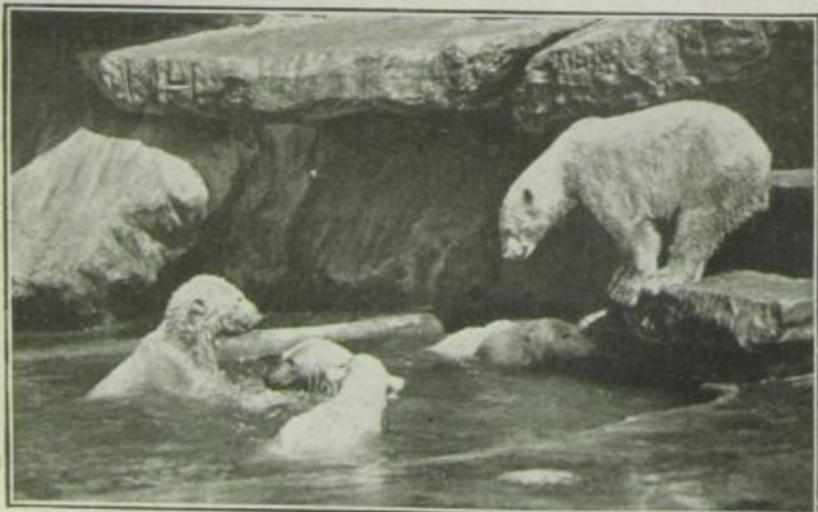
Familie Eisbär badet