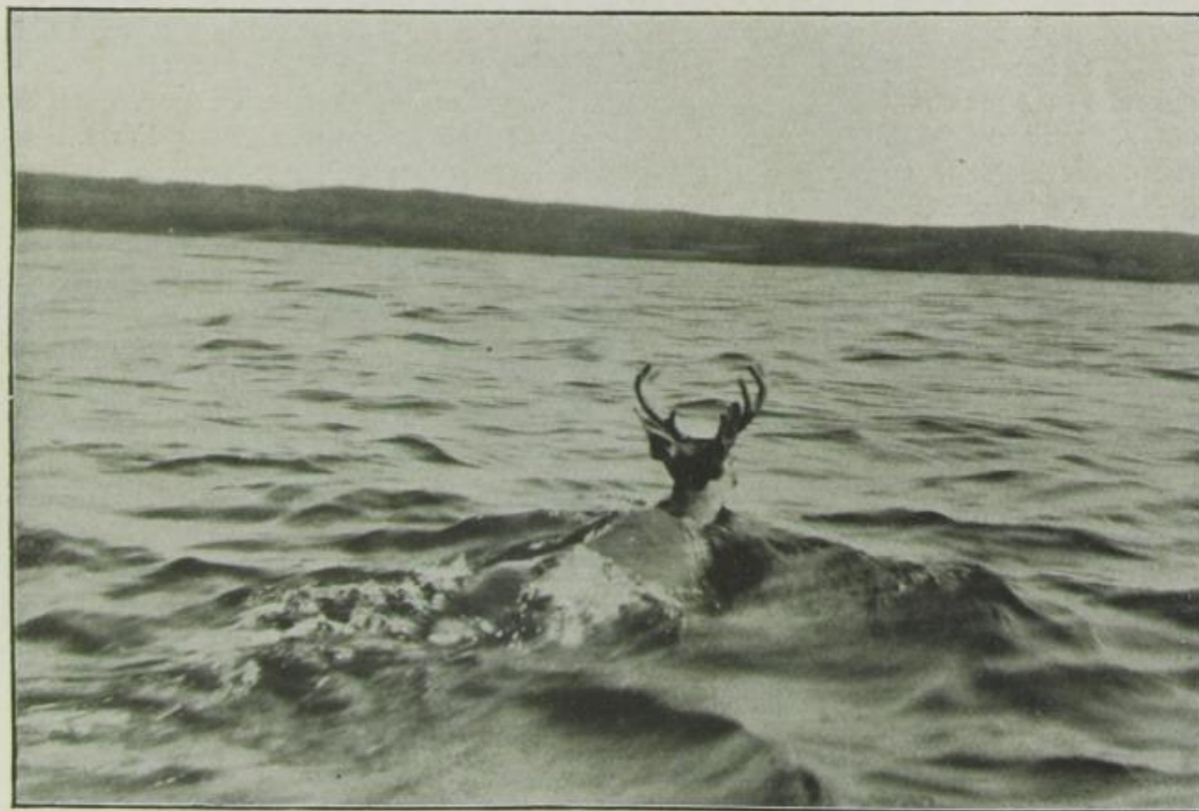
Ein Hirsch durchschwimmt mühelos dieselbe Strecke