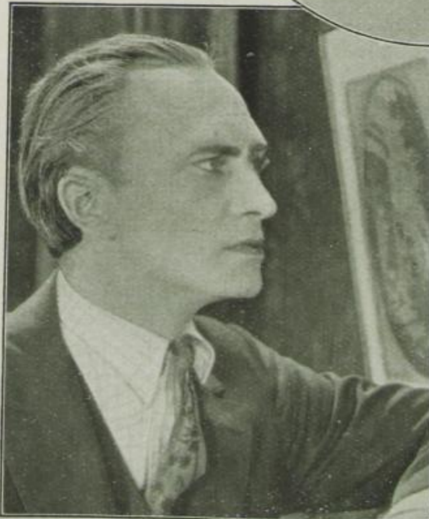
Conrad Veidt verließ Deutschland, um in Hollywood bei der Filmfirma Universal zu spielen