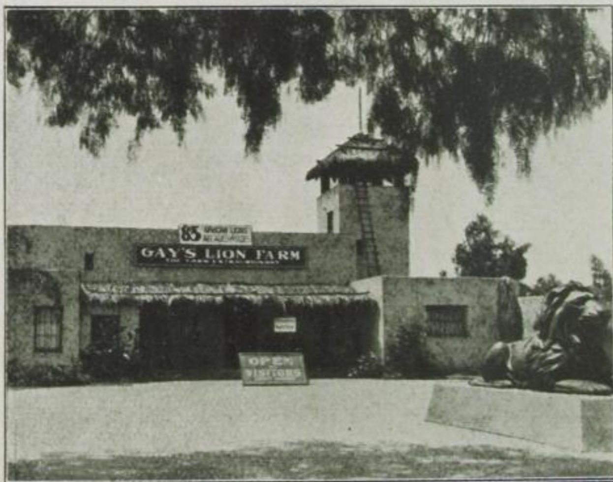
Gay's Löwenfarm in Kalifornien

Haben Sie nicht, gnädige Frau, wenn Sie Ihr entzückendes Füßchen in einen Schuh aus Schlangenhaut stecken oder, um sich Ihr Näschen