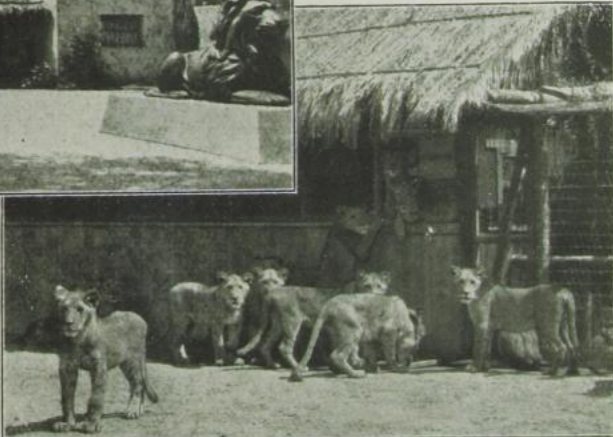
Mitte: Vielversprechender Nachwuchs —