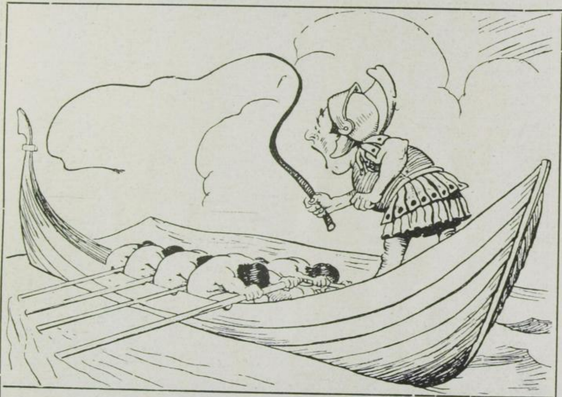
200 vor Christi