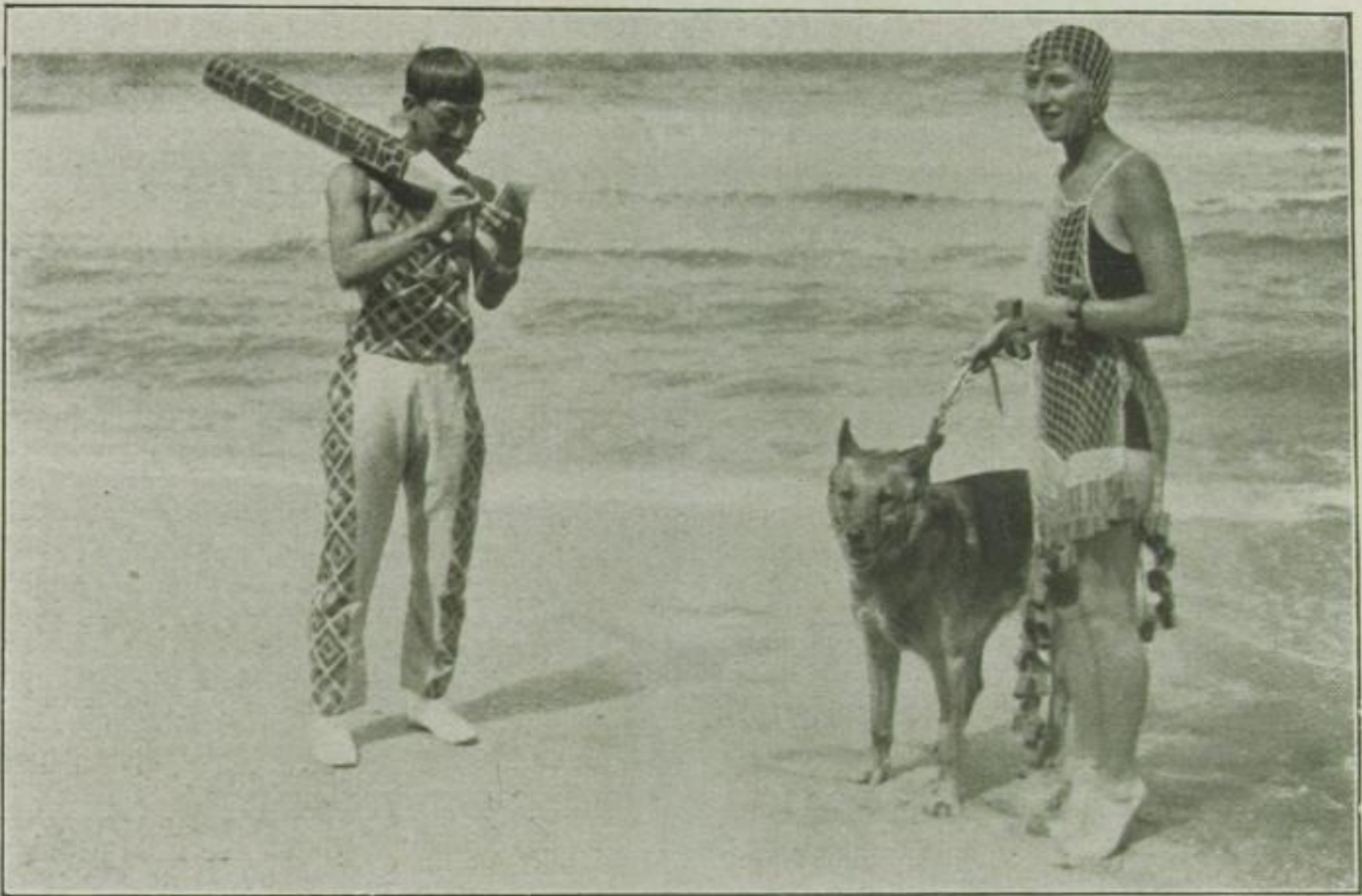
Der japanische Maler Foujita bei einem Strandfest in Deauville