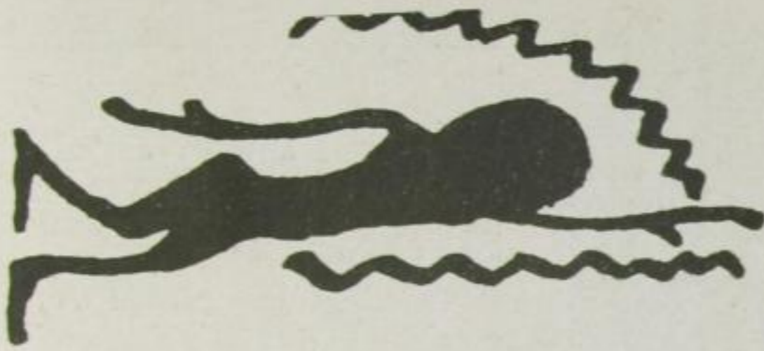
Eine ägyptische Hieroglyphe, die aus dem Jahre 3000 vor Christi stammt, schwimmt Hand über Kopf Crawl