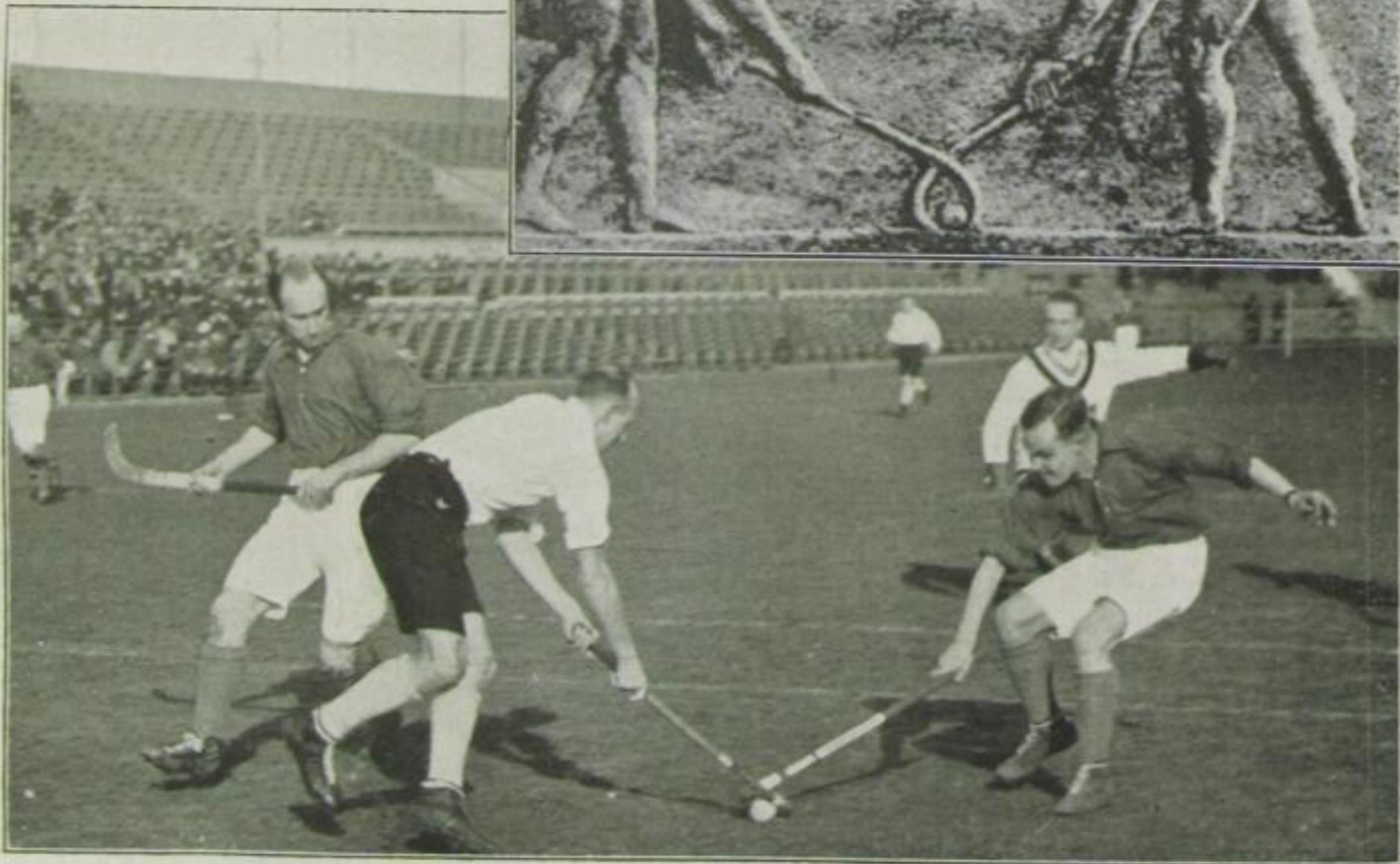
Antikes Hockey-Match auf einem Relief zu Athen und dieselbe Szene aus unserer Zeit

volles System gebracht und bei kultischen Anlässen den griechischen Volksmassen als Schauspiel dargeboten wurden. Die moderne Sportrenaissance knüpft an dieses historische Beispiel an: das „Gymnasion“ der Griechen ist heute noch ein kaum erreichtes „Vorbild“ klassischer Sportkultur.