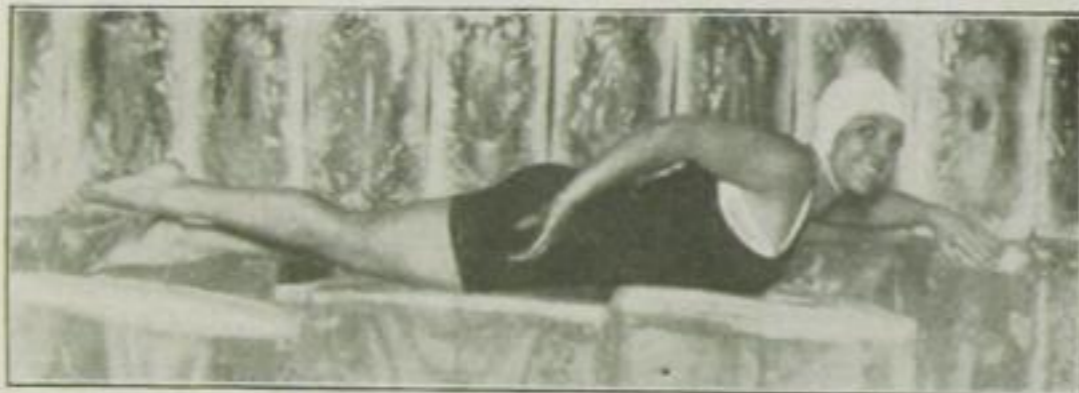
Eine moderne Wassernixe bei der Uebung für die Technik im Langstreckenschwimmen, den Crawl

Erfindung ist. Aber die steinerne Visitenkarte, die uns das Altertum in Form eines altgriechischen Vasenbildes als antikes Seitenstück hinterlassen hat, beweist — hoffentlich kann es unser Sportstolz ertragen —, daß schon 500 Jahre vor Beginn unserer Zeitrechnung dieser Sport geübt worden ist. Vielleicht auch hat der nach Heros Liebe dürstende Leander den Hellespont im Crawl, der