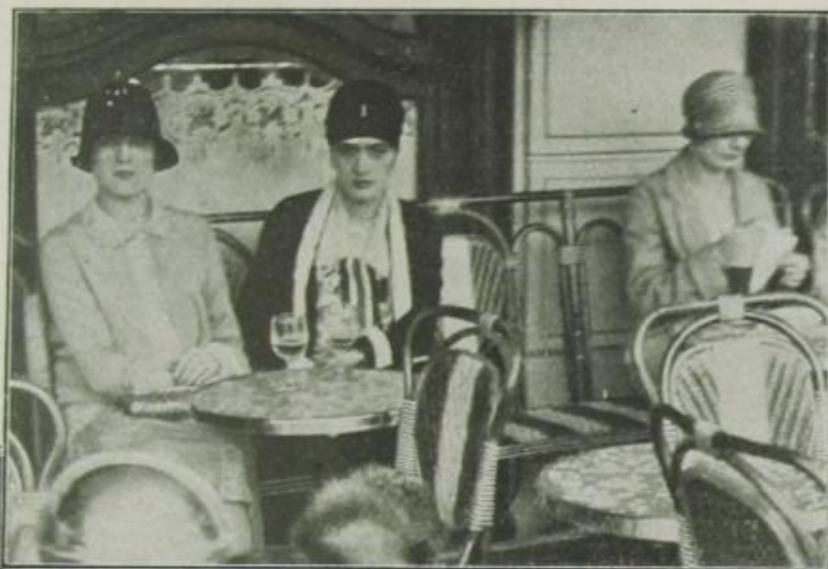
Die Gattinnen bekannter Börsianer in einem Boulevard-Café in der Nähe der Börse

sich als vernünftiger Mensch alle Widerstände gegen diese Stadt in die Erinnerung rufen . . . Sie werden gegen die allzu große Geschäftstüchtigkeit protestieren . . . Sie werden sich einreden, daß die Museen von Berlin, London und Newyork ebenso viele Schätze bergen wie der Louvre . . .