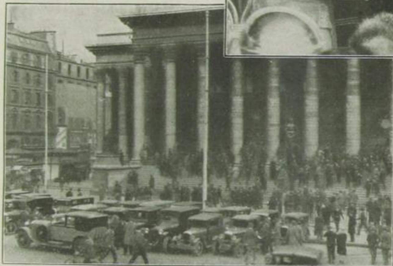
Die Pariser Börse an einem großen Tag

der Eiffelturm wird für Sie ein Haufen Eisen sein, und die historischen Erinnerungen werden Sie mit denen von Rom und Athen vergleichen . . . wobei Paris den Kürzeren zieht . . . und Sie werden in Le Bourget landen und fest entschlossen sein, Ihre Geschäfte auf dem kürzesten Wege zu erledigen . . .