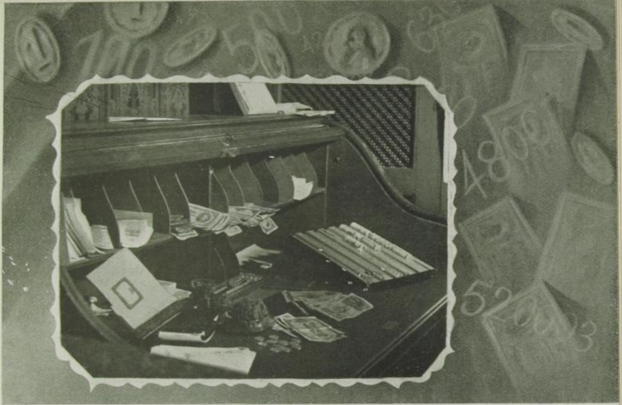
Der Arbeitstisch des Kassierers

neueste Dekobra-Novelle und aus dem Stenogrammheft herausragend der angeknabberte Bleistift.