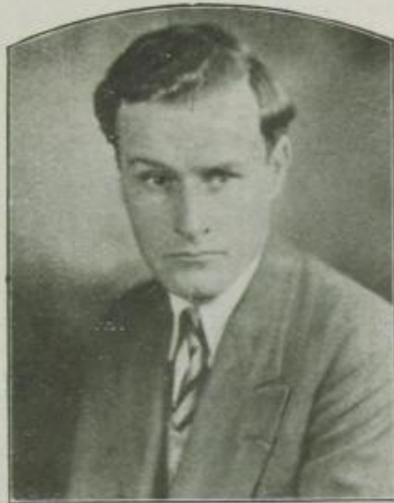
Der Regisseur William Wellmann