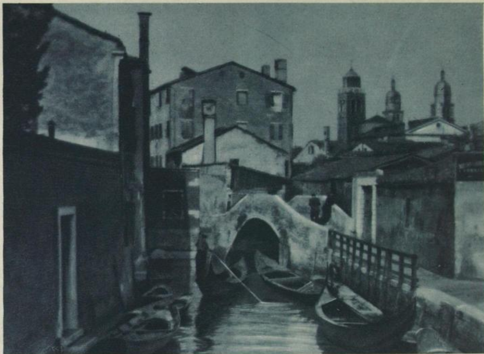
Venedig von der Kehrseite