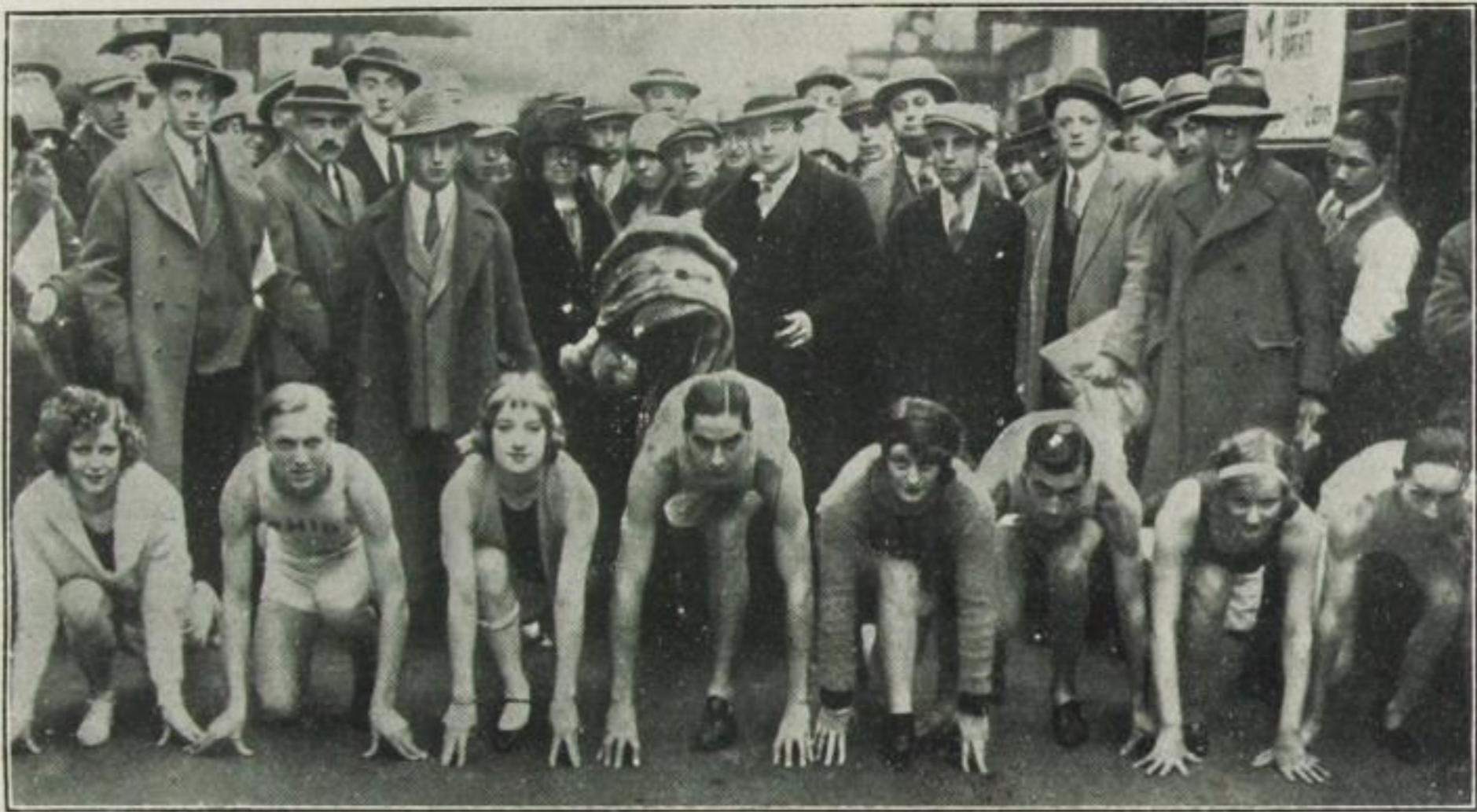
Ein gemischter Start