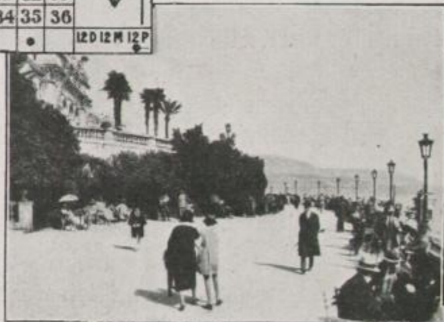
Vormittagsbummel auf der Promenade des Anglais

29. Vormittag. Ein bißchen auf der Promenade umhergeschlendert. Überall sitzen Leute herum, die eifrig debattieren. Aber nicht über Politik, über Kunst oder wissenschaftliche Probleme. Nein, alle sind Mathematiker. Ihre Gedanken beschäftigen sich ausschließlich damit, nach der Wahrscheinlichkeitsrechnung die Rillen zu bestimmen, in denen die Elfenbeinkugel der Roulette im Laufe des Abends fallen müsse. — — Jetzt verstehe ich auch, wes-