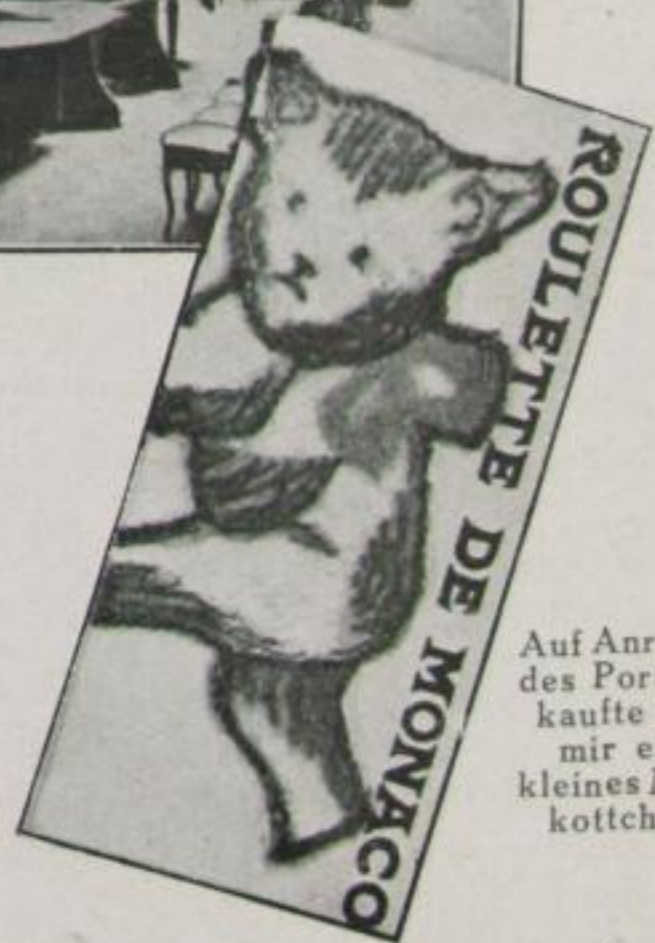
Auf Anraten des Portiers kaufte ich mir ein kleines Maskottchen

30. Nachts. Ich hätte gleich wissen sollen, daß Katzen falsch sind. Einen Hund hätte ich mir kaufen müssen. Ich besitze nur mehr 1000 Franc.