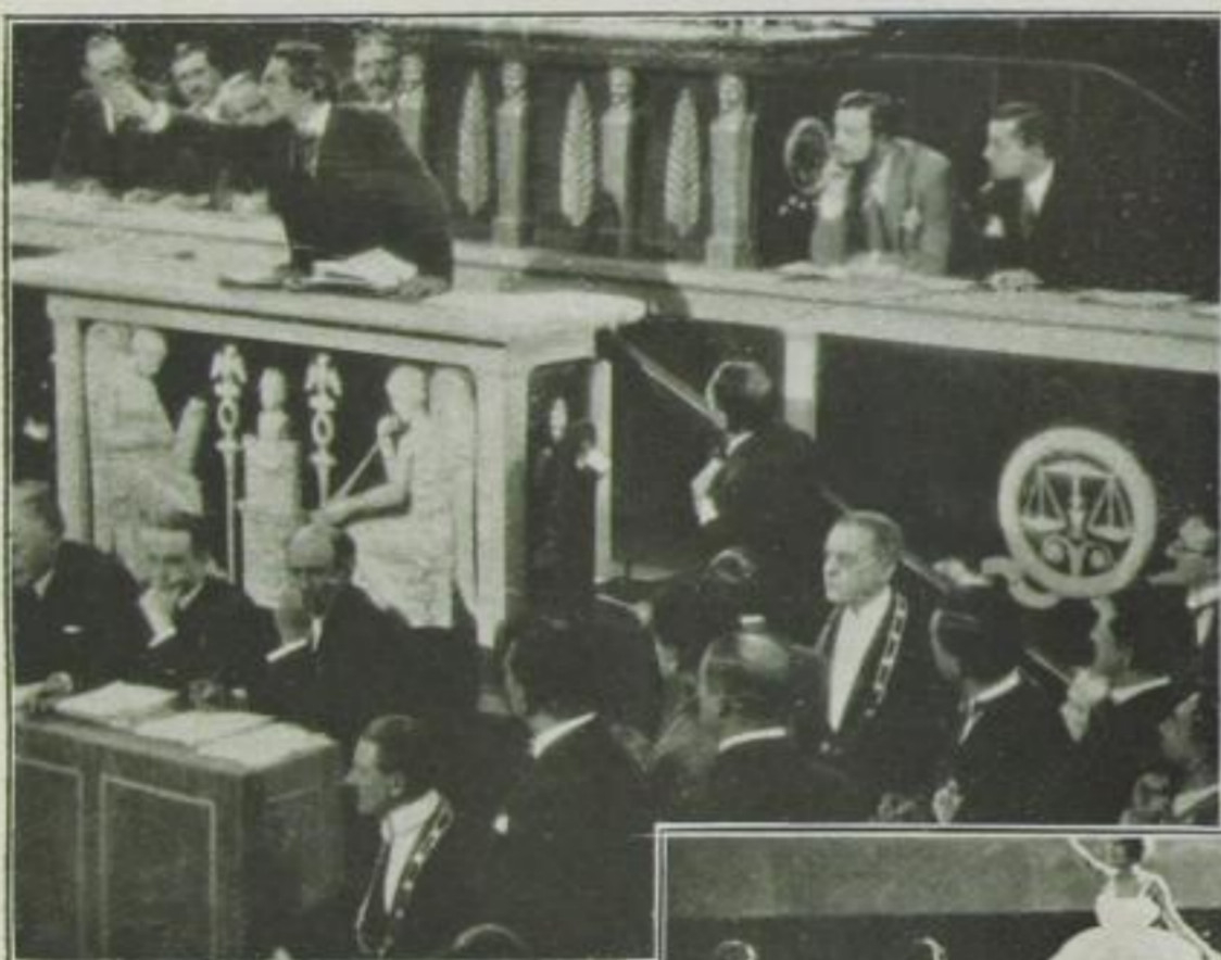
Eine stürmische Sitzung im französischen Parlament

Erlebens Jaques Feyder glossiert mit Grazie, Esprit und Charme die geheimen diplomatischen und politischen Rankünen, die sich um eine schöne Frau spinnen. (Rechts oder links — geschoben ist geschoben!) Bewußt raffiniert stellt er seine Hauptdarstellerin Gaby Morlay, eine glückliche Mischung zwischen Elisabeth Bergner und Käthe von Nagy, in den