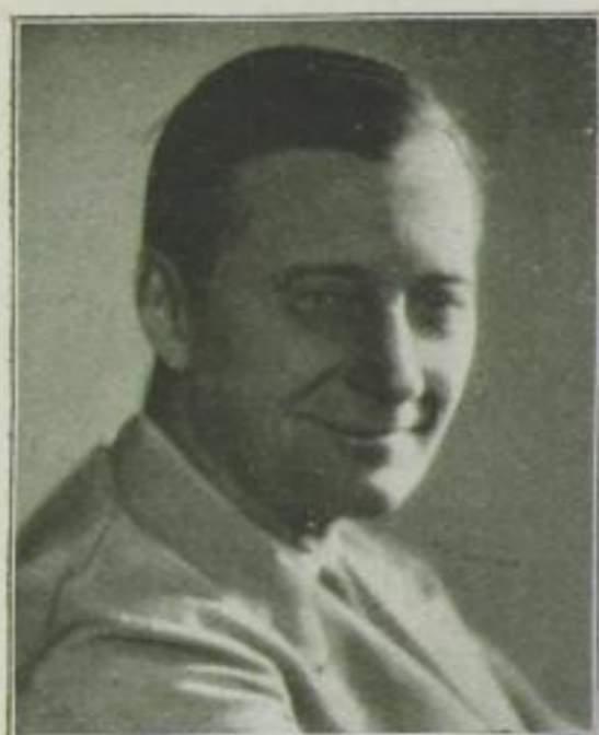
Der Regisseur Jaques Feyder