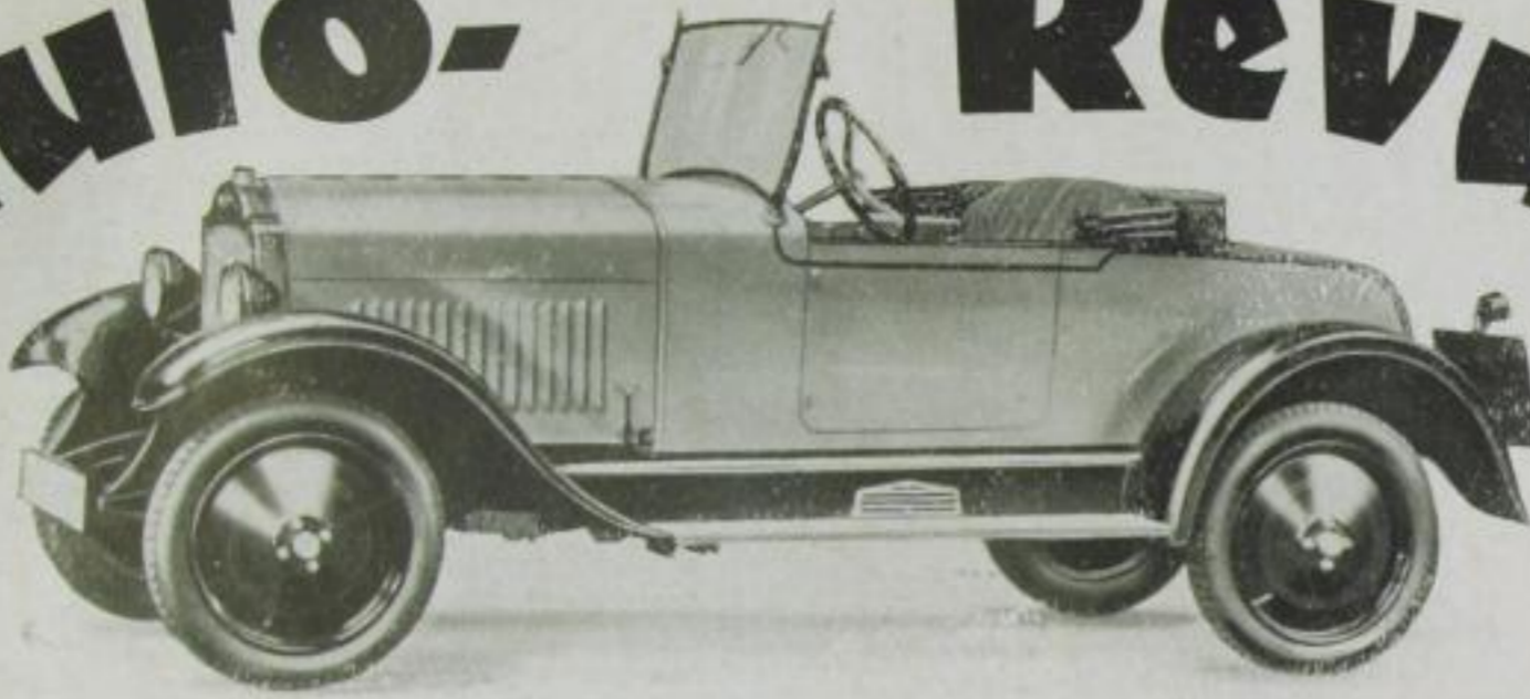
Das erste Automobil unter 2000 RM. Der 4 PS-Opel-Zweisitzer zum Preise von 1990 RM.

Zusammengestellt von Wolfgang von Lengerke