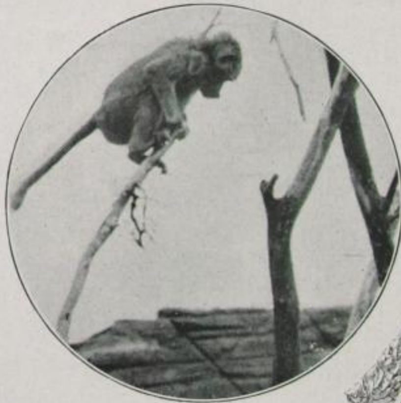
Schimpanse (Simia troglodytes) im lebenswahren Kulturfilm und in einer unnatürlichen Zeichnung eines Lehrbuches

Unter einer unsichtbaren Last hastet der Gymnasiast zur „Penne“, den Kopf bis zum Bersten angefüllt mit algebraischen Formeln, Geschichtszahlen, lateinischen, griechischen und französischen Vokabeln und einer unübersehbaren Skala unregelmäßiger Verben. Wie ein Ladenverkäufer hat er sich auf seine Kundschaft, die „Pauker“, bereits eingestellt. Er weiß, daß im Lateinischen nach dem Buche abgefragt, im Griechischen extemporal unterrichtet wird und er in der Mathematik und Algebra rettungslos aufgeschmissen ist. Und auf den Trümmerhaufen eines soeben mühsam zusammengekrampften Wissens erscheint als Menetekel zudem noch das Achtungssignal: „Von 11—12 Naturkunde!“ Der Gymnasiast weiß nur, daß er in der großen Pause eine Viertelstunde Zeit hat, um an einem „stillen Ort“ sich noch den Rest seines Gehirns vollzupfropfen: „mit den Tieren 9. Ordnung, Paarzeher (Artiodactyla), die wieder in die erste Unterordnung, in nicht wiederkäuende Paarzeher (Artiodactyla non ruminantia)