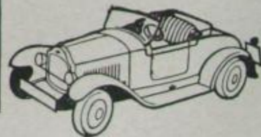
4 PS ZWEISITZER