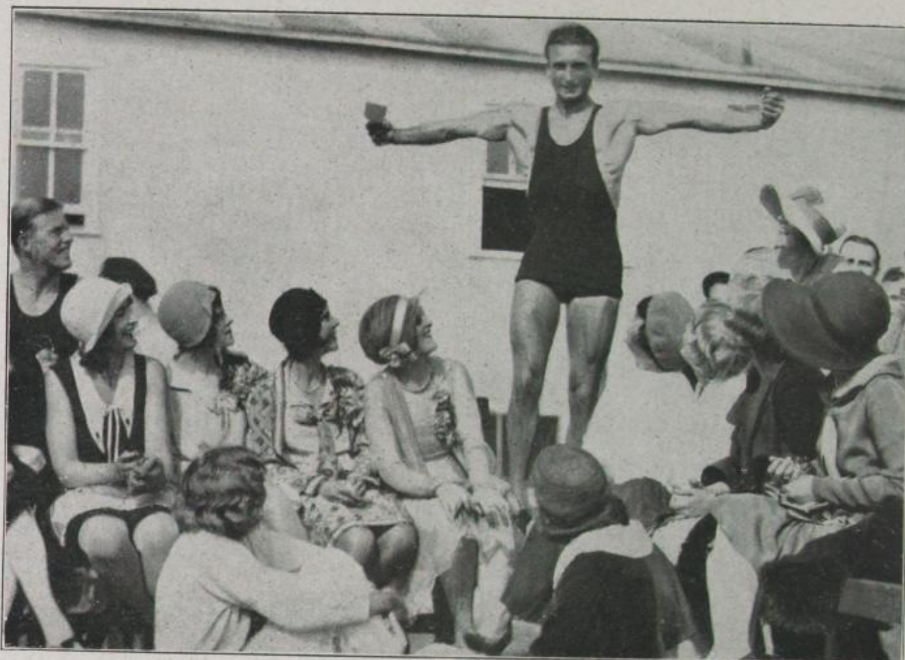
Der Sieger in einer männlichen Sex-appeal-Konkurrenz in Kalifornien

darstellt. Und doch hat jeden ungeheuren Charme, die süße Pikanterie, die man oft bei der vollkommenen Schönheit vermischt.