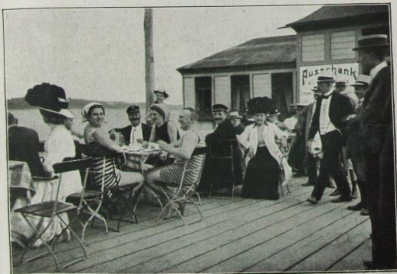
Der Skandal im Erfrischungsraum des Seebads Wannsee (Das Betreten der Restaurationsräume im Badeanzug war poli- zeilich verboten)