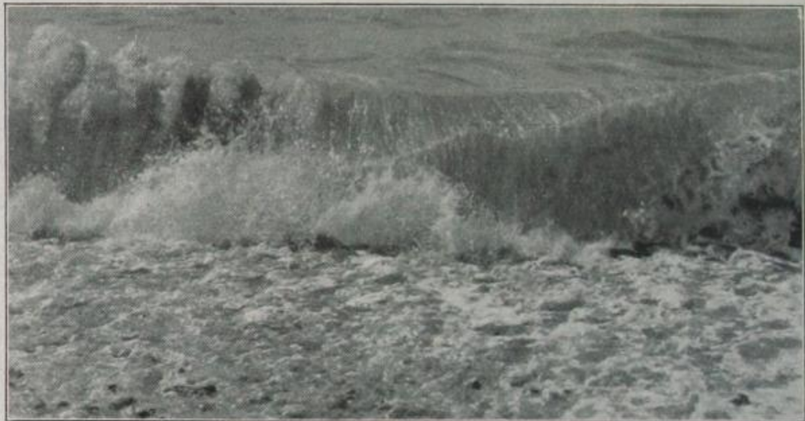
Die Welle brandet ans Ufer

Photographische Naturstudie von Graf Zedtwitz, Nizza