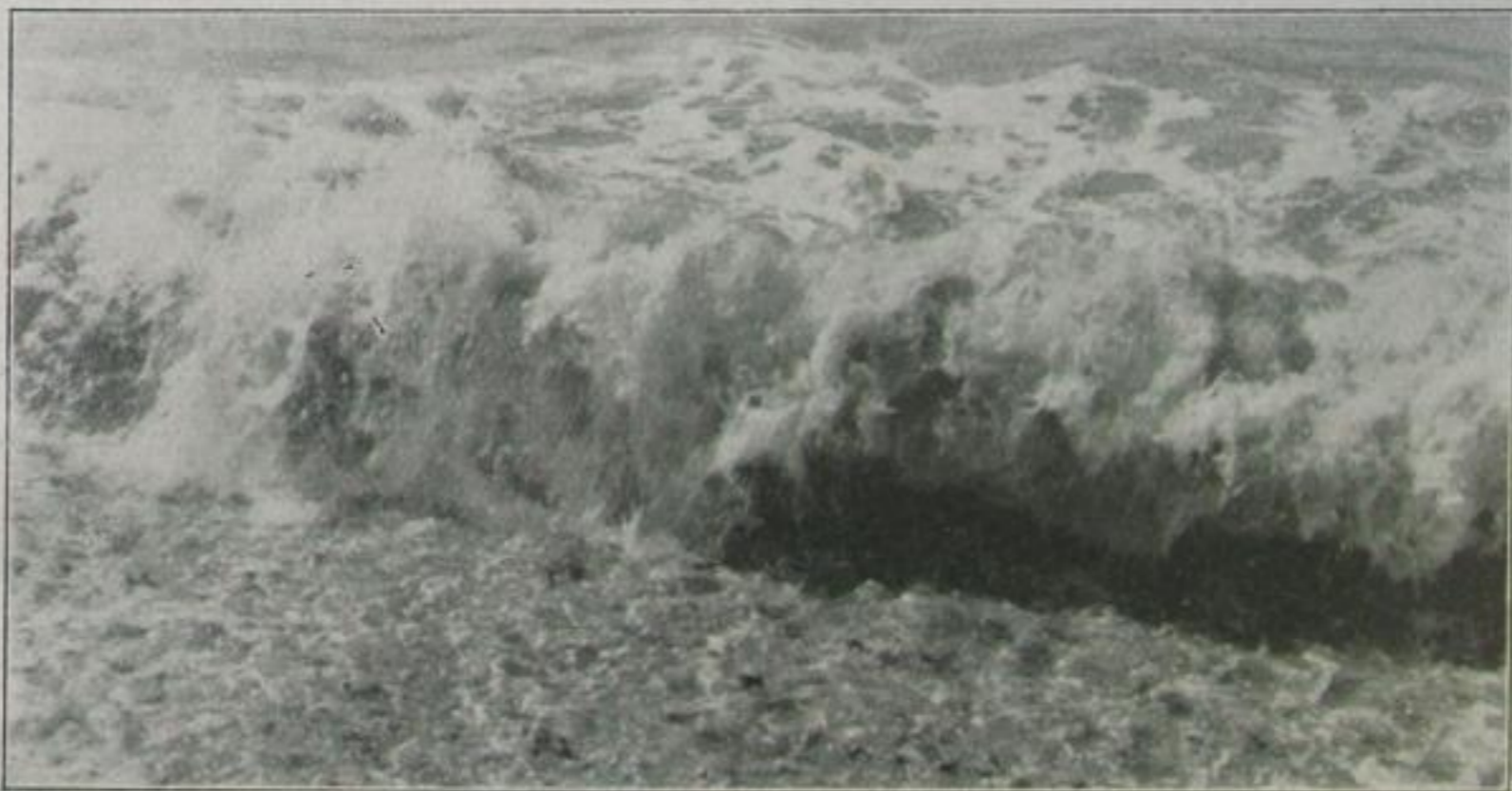
— und löst sich in Schaum auf