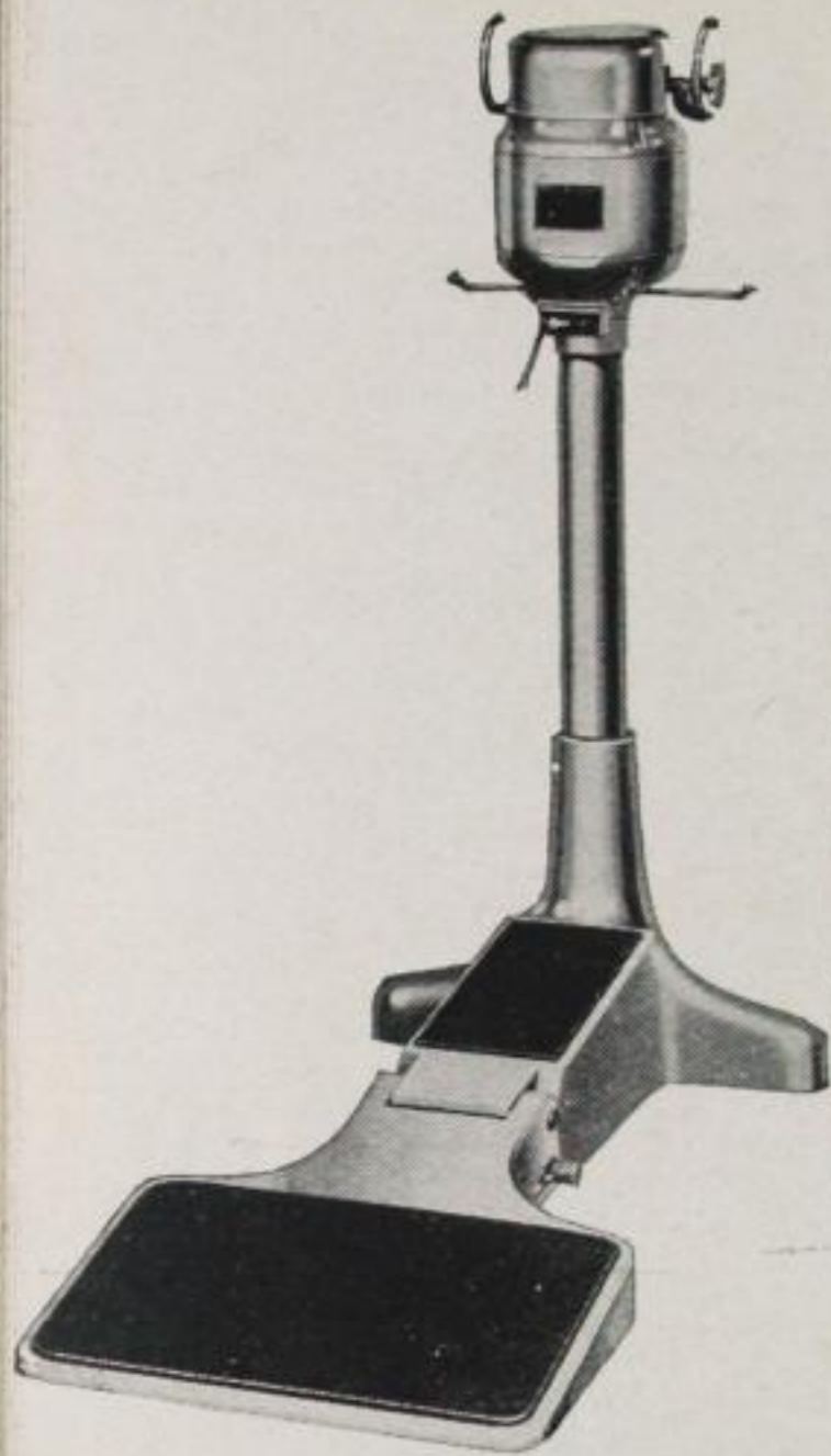
Das neue Modell eines elektrischen Massage Motors