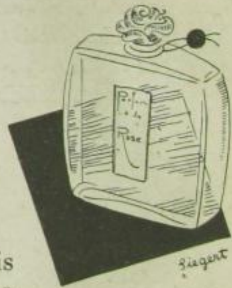
„Rose“, das Parfum der bürgerlichen Frau

reicht, spricht zu gleicher Zeit ein diskretes Geständnis „Erstes Herzklopfen“, eine Hoffnung „Liebesnacht“, eine Furcht „Erinnerung, die vergeht“, eine Hoffnung „Auf morgen“, eine Dankbarkeit „Kuß auf den Mund“ aus ... Parfums wirken auf die Einbildungskraft, richten sich direkt an die Sinne und rufen die Liebe! Sie sind