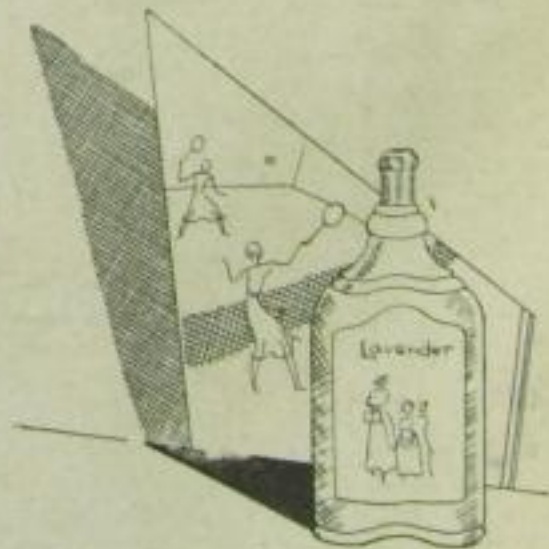
„Yardley-Lavender“ (Lavendel — von Sportgirls bevorzugt)