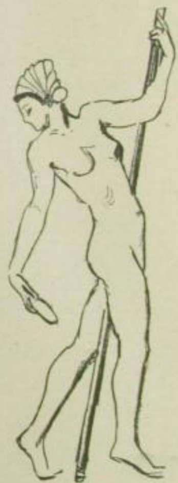
Griechinnen tanzen nackt — eingeweiht in die Mysterien, hingerissen von Dionysos