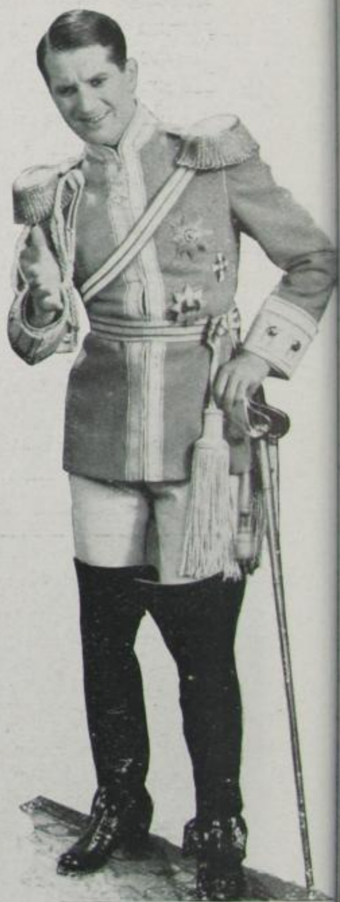
Maurice Chevalier und Jeanette Mac Donald

Deutschland sich den Kopf über den Stil der Tonfilmoperette zerbrachen und experimentierten, schuf ihr Altmeister in Amerika den Film, der nach Handlung und Musik nichts anderes ist, als eine Bühnenoperette alten Stils — aber er hieße nicht Lubitsch, wenn er uns nicht auch zugleich filmisch das alles bescherte, was seinen einzigartigen Ruf rechtfertigt: Die bezaubernden Einfälle, die kammerspielartige Feinheit, den Schwung und die große Linie der Massenszenen.