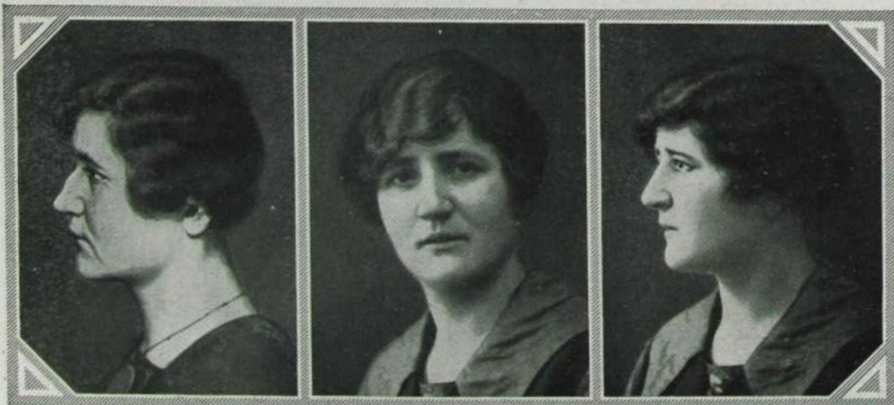
Verschönerung des Gesichtes durch Beseitigung eines Nasenhöckers und der Faltenbildung der Haut

Aber auch die natürlichen Alterserscheinungen des Gesichtes, die sich durch