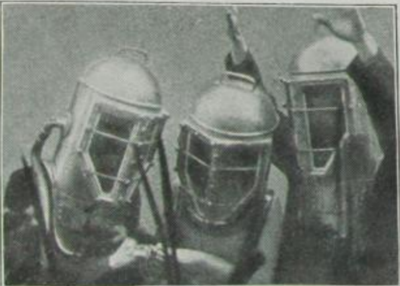
Die Trauungszeremonie unter Wasser