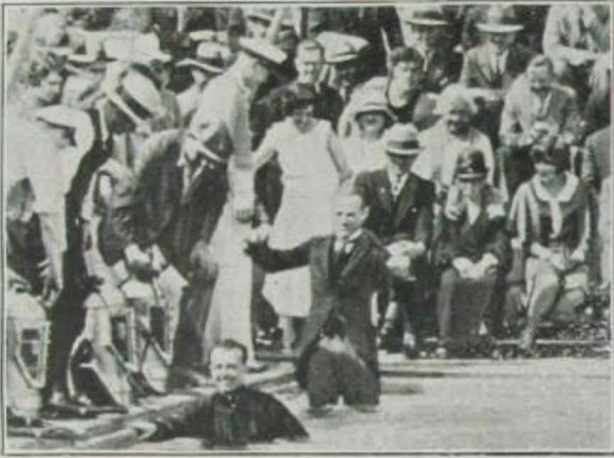
Der Geistliche geleitet das Brautpaar in das Schwimmbassin