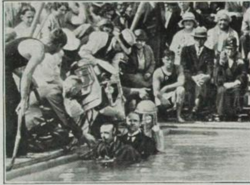
Die Taucherhelme werden aufgesetzt zur „nassen“ Trauung im „trockenen“ Amerika