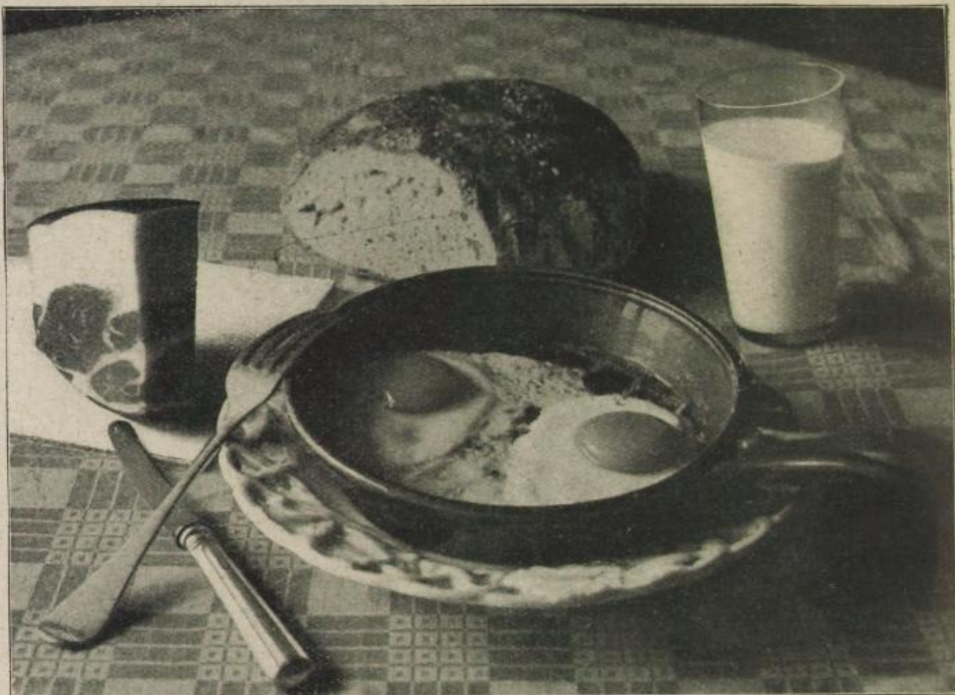
Eine appetitliche Sache: Spiegeleier mit Landschinken