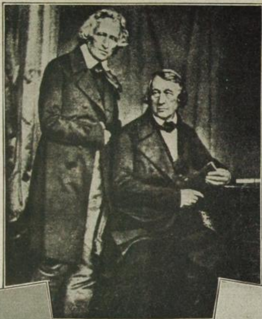
Die Gebrüder Jacob und Wilhelm Grimm