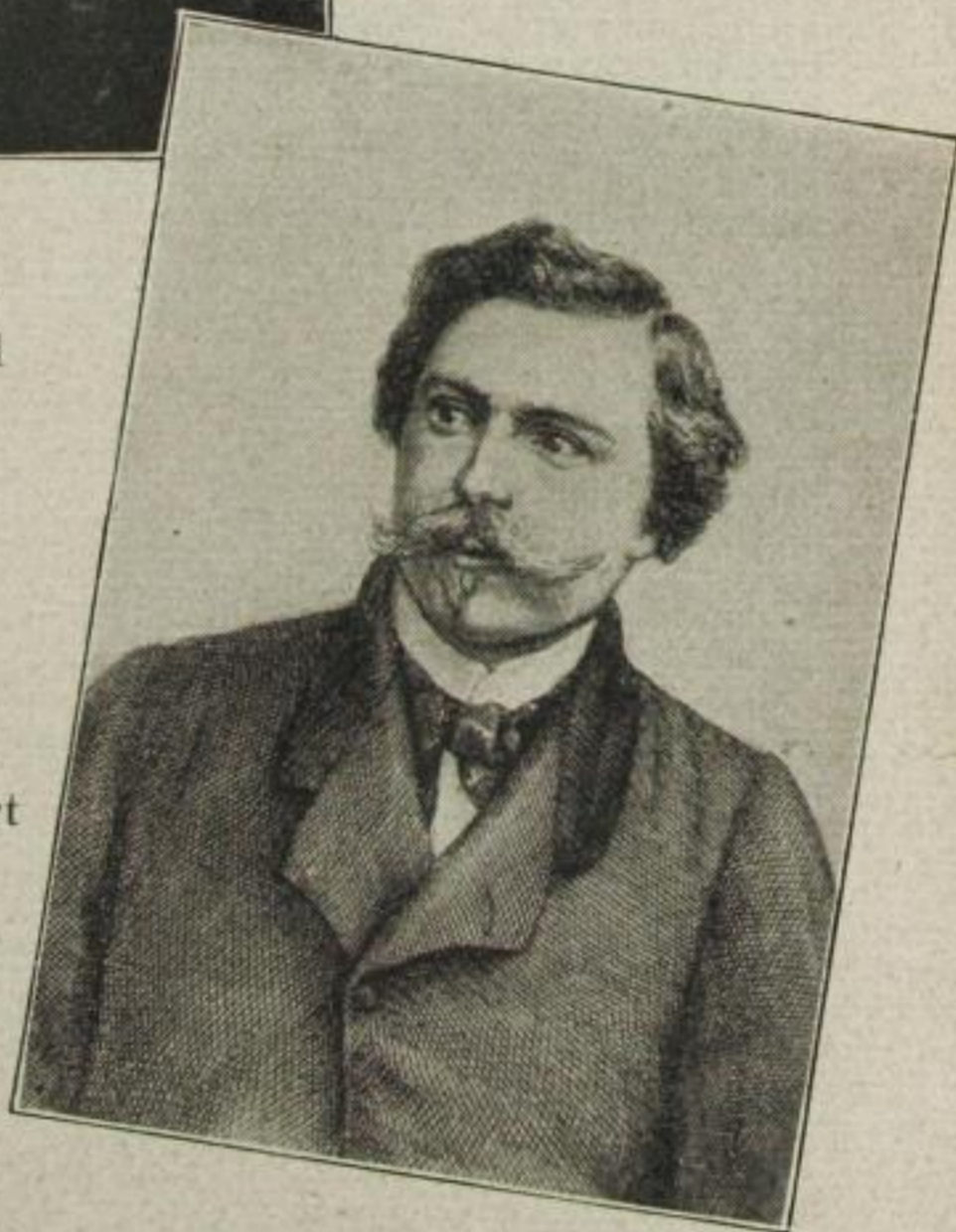
Edmond und Jules de Goncourt